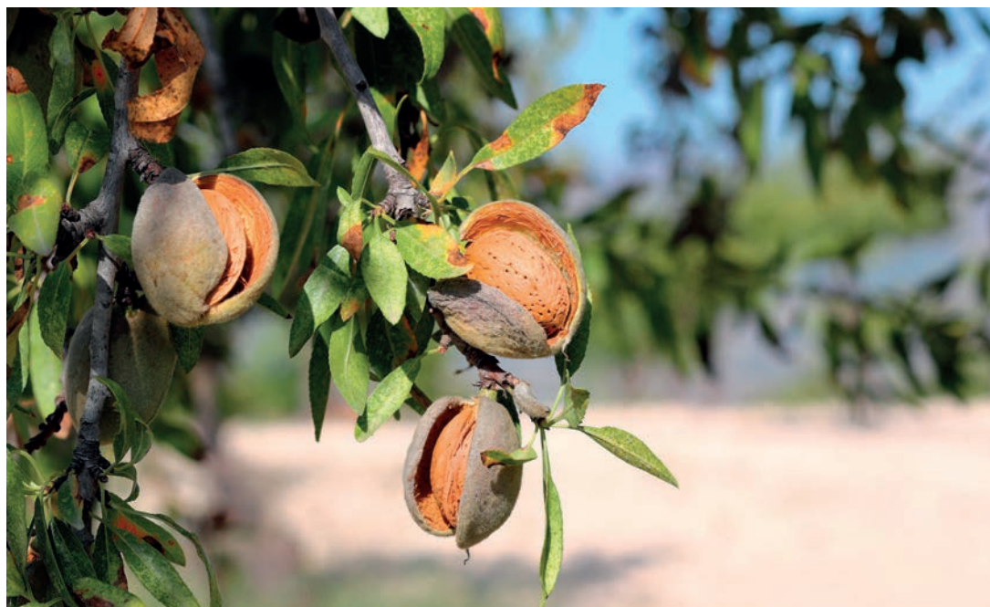
Más de 200.000 almendros españoles no serán erradicados gracias a la nueva normativa europea sobre la Xylella.

Además de las medidas de erradicación y contención, la norma prevé la plantación de vegetales especificados en zonas