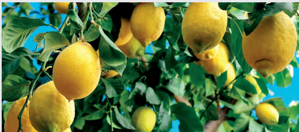
Ailimpo lidera la iniciativa en materia de contratos tipo en el sector cítrico español, y el limón y el pomelo son los únicos cítricos que disponen de esta imprescindible e importante herramienta.

Esta campaña los cinco contratos incluyen tres novedades importantes: La primera es la adaptación a la reciente modificación de la Ley 12/2013, incluyendo una referencia expresa a