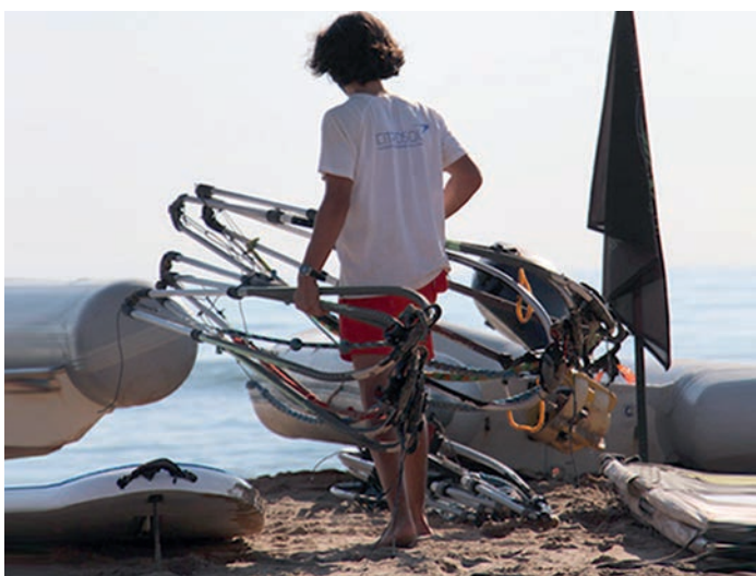
La empresa patrocina la escuela de surf de Gandía.

El entusiasmo de monitores y alumnos por aprender en los valores del deporte y la convi-