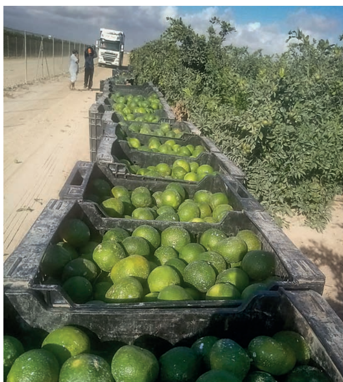
Recoger la fruta antes de tiempo y cuando todavía no cumple los requisitos adecuados de madurez, color o grados Brix, es una auténtica temeridad e irresponsabilidad que puede tener efectos muy negativos para la campaña.

La Unió espera que sean simplemente casos aislados y que en esta campaña cítrica se proceda con rigor; que cesen ya de este modo las prácticas especulativas