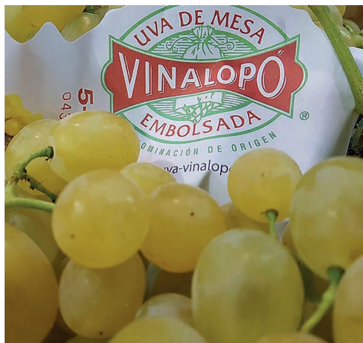
La uva embolsada del Vinalopó con denominación de origen es un reconocimiento a la calidad y a la tradición.

Con el apoyo de la Universidad, desde la Mesa Provincial del Agua, el objetivo es mostrar lo razonable de este sector en cuanto a un uso responsable y respetuoso del un medio escaso, como es el agua de riego y