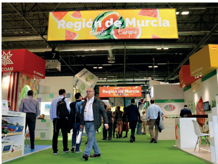
Fruit Attraction mantiene su convocatoria para la edición de 2020.

SIAL: El reto de alimentar a una mayor cantidad de población, la seguridad alimentaria o cómo la industria se está adaptando a la crisis sanitaria del coronavirus, son algunas de las temáticas que protagonizarán el Salón Internacional de