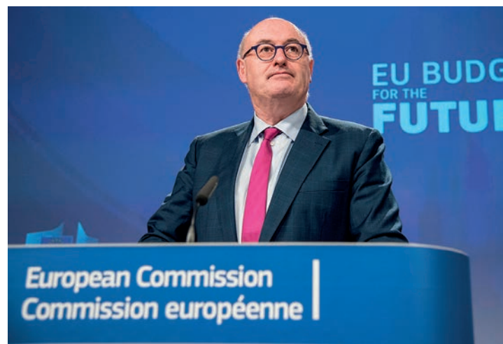
Phil Hogan era comisario europeo de Comercio desde noviembre de 2019.

Ya desde su anterior cargo en la Comisión Europea del luxemburgués Jean-Claude Juncker, en