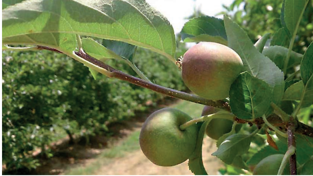
Un invierno y una primavera más lluviosa que la media ha afectado a la floración resultando una producción menor.