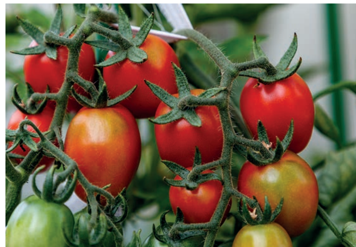
Daymsa sigue a la vanguardia en los procesos de investigación, desarrollo, comercialización y certificación de productos ecológicos.

De esta manera, Daymsa sigue a la vanguardia en los procesos de investigación, desarrollo, comercialización y certificación