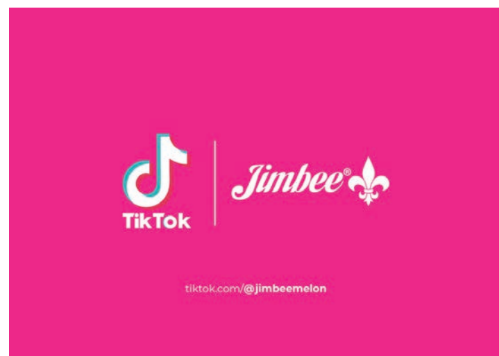
La empresa melonera Jimbee acaba de lanzar su cuenta en TikTok.

clara muestra del compromiso de la empresa con la producción ecológica, cuya superficie mundial se sitúa en 71.500 millones de hectáreas y creciendo año tras año.