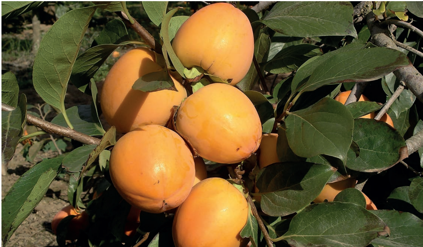
Para esta campaña se espera en la Comunitat Valenciana una producción cercana a las 300.000 toneladas.