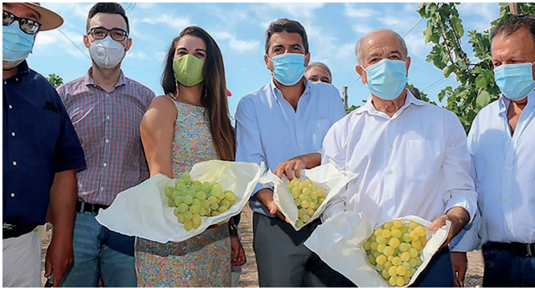
La consellera de Agricultura confirmó al sector el apoyo y el acompañamiento de las administraciones.

El presidente de la Diputación Provincial, Carlos Mazón, por su parte ha expresado su disposición firme para ayudar a este sector, que se esfuerza cada año en llevar las mejores uvas a nuestras mesas. El compromiso alcanza a ratificar y solidarizarse con el manifiesto surgido a primeros de año, como respuesta a todos los problemas que viene sufriendo el sector desde hace años y que en la presente campaña se ve agravado por culpa de la pandemia. Mazón también ha expresado la necesidad de seguir apoyando