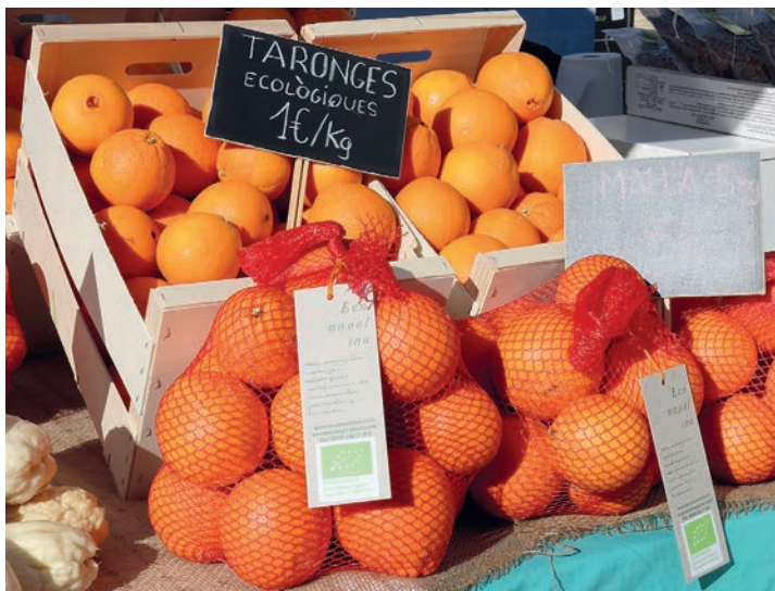
La agricultura ecológica de la Comunitat Valenciana lidera los principales indicadores de crecimiento a nivel estatal.

En 2019, la superficie ecológica en el territorio de la Comunitat creció 11,7% con respecto a 2018, una cifra que supera al doble de la media estatal, que se situó en el 4,8%. Unos datos significativamente por encima de la