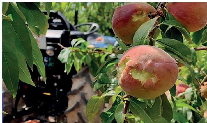
Uno de los cultivos afectados por el granizo fue el melocotón.

Otras zonas con un volumen importante de siniestros fueron La Litera, Bajo Cinca y Hoya de Huesca, en la provincia de Huesca, y Ejea de los Caballeros, en Zaragoza.