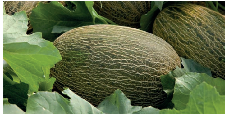
Las exportaciones se han incrementado durante el mes de agosto.

Las estimaciones de la interprofesional pasan por una producción de total de campaña —que "finalizará previsiblemente, como todos los años, para la virgen del Pilar" (12 de octubre)— en torno a las 180.000 toneladas de sandía (2.719 hectáreas plantadas, 84 más que en 2019) y 200.000 toneladas de melón (5.854 hectáreas, -6%).