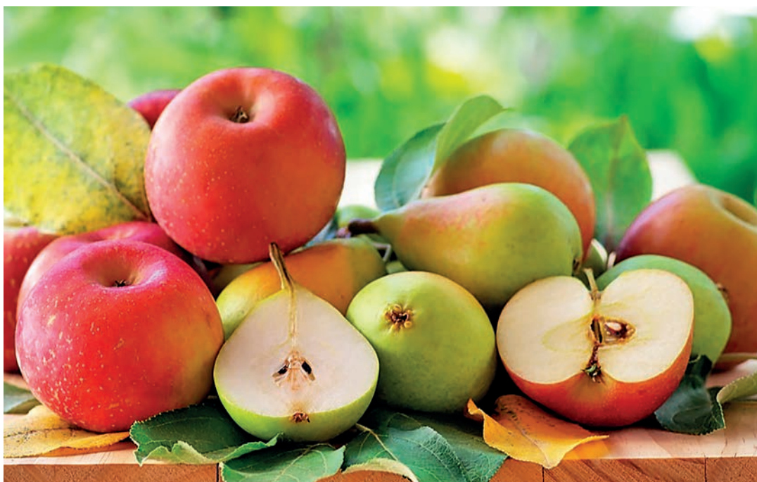
La cosecha de manzana en Europa en 2020 será de 10.711.000 toneladas, un 4% menos respecto a la media de los últimos tres años y la variedad Golden sigue con su tendencia a la baja. En pera, a pesar del ligero incremento productivo en relación al año pasado, el volumen total previsto es uno de los más bajos de estos últimos ocho años.