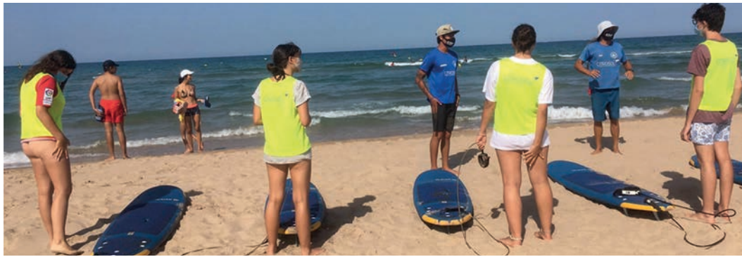
Actividades de la escuela de verano Gandía Surf desarrolladas durante este verano.