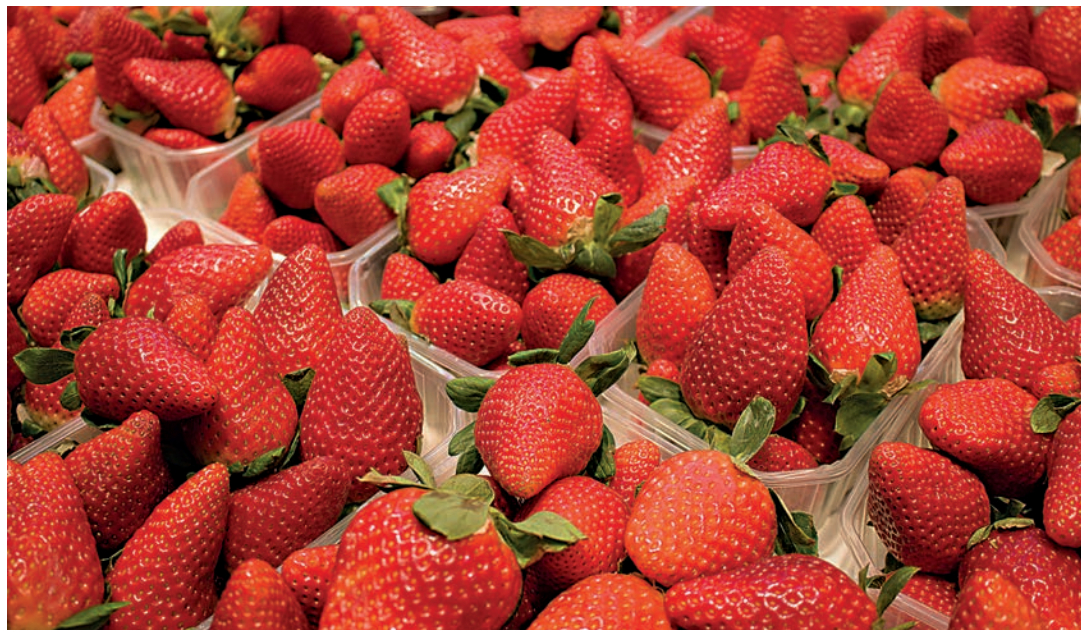
Los datos del primer semestre, según Fepex, reflejan situaciones muy dispares, con retrocesos en producciones importantes como los frutos rojos.

Por comunidades autónomas, la exportación hortofrutícola de Andalucía de enero a junio de 2020 se situó en 2,7 millones de toneladas, un 4% menos que en el mismo periodo de 2019, por un valor de 3.788 millones de euros (+5%). Le siguen la Comunitat Valenciana, con 2 millones de toneladas (-8%) por un valor de 2.166 millones de euros (+12%), y Murcia con 1,4 millones de to-