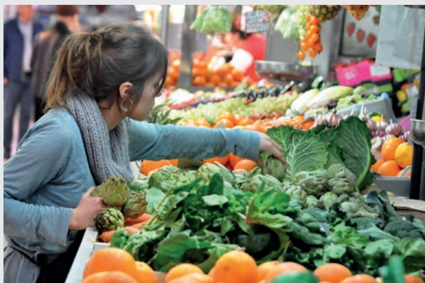
Mercado de Ruzafa.

También en producción ecológica los agricultores valencianos están dando el 'do de pecho' y consolidan su liderazgo