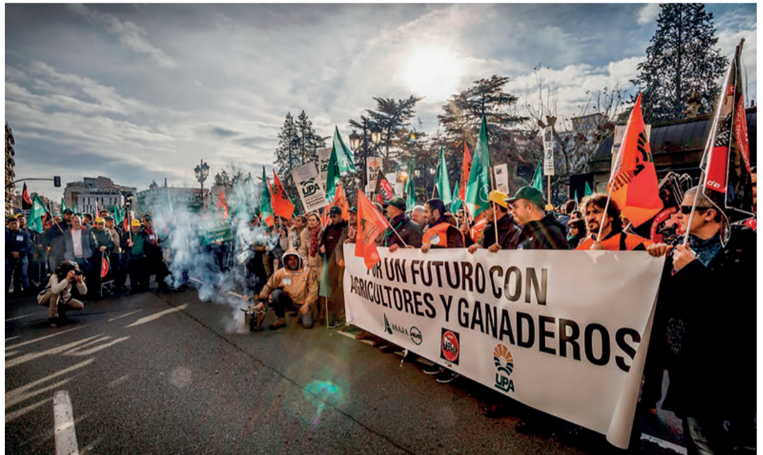
Las manifestaciones pretendían "cambiar las cosas y producir un cambio de tendencia". /VF

Una reunión celebrada en el marco de encuentros que Planas organizó con los distintos eslabones de la cadena agroalimentaria para estudiar posibles soluciones a los problemas que padecen los productores españoles. El objetivo de la modificación 'parcial e inmediata' de la ley de la cadena de 2013 era según el ministro "lograr un reparto más justo del valor de los productos agrarios a lo largo de los eslabones que la integran; un mayor equilibrio por medio de una relación más precisa de prácticas comerciales prohibidas, una regulación del valor de los productos agrarios y la obligatoriedad de la inclusión del coste de producción para establecer los precios en los contratos". Los representantes de las organizaciones agrarias por su parte confirmaron su intención de continuar con las movilizaciones porque "demandamos solu-