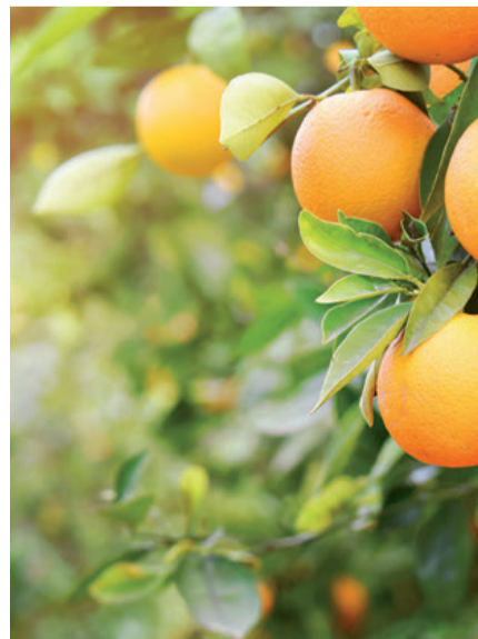
Este año hubo menos naranjas.

El Departamento Norteamericano de Agricultura (USDA) cifró la producción mundial de naranja de la campaña 2019/2020 en 47,5 millones de toneladas, 5,8 millones menos que en la temporada 2018/19 (-0,88%). La autoridad agrícola estadounidense achacó este menor volumen a los efectos de un “clima desfavorable” en los cultivos de Egipto, Unión Europea y Marruecos, pero sobre todo en los de Brasil, el mayor productor mundial. De hecho, en este último país, la producción —según el informe del USDA— cayó un 22%, hasta los 15,1 millones de toneladas, debido a las temperaturas cálidas y precipitaciones por debajo del promedio después de las dos primeras floraciones y cuajado de frutos. La producción de China, en contraste, subió ligeramente, hasta 7,3 millones de toneladas, gracias a las condiciones climáticas favorables; sus importaciones —Egipto y Sudáfrica son sus principales proveedores— crecieron un 3% impulsadas por la “creciente demanda del consumidor de naranjas premium y de alta calidad”. Por su parte, la Unión Europea recolectó 5,8 millones de toneladas, un 10% menos que en la temporada anterior, por el clima desfavorable que afectó a la floración y el cuajado. ■