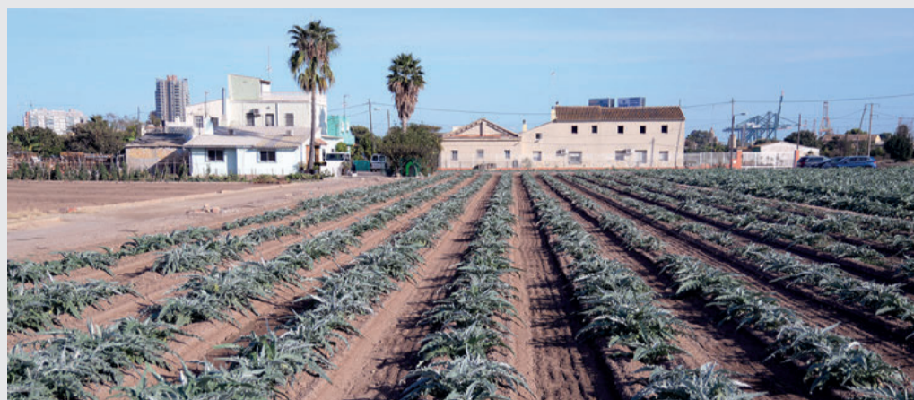
Europa no ha atendido la demanda de ayudas de la agricultura mediterránea.