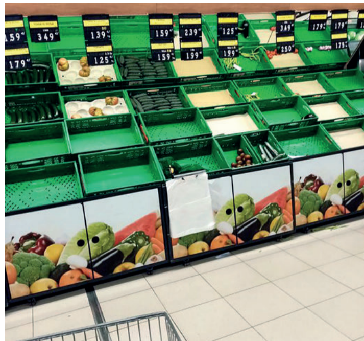
La incertidumbre hizo que la población comprara de forma masiva.

sumaron otros como la falta de mano de obra para las campañas, el aumento de los costes por las medidas sanitarias, el cierre de la hostelería y la cancelación de fiestas. No obstante, el sector hortofrutícola español, “la huerta de Europa”, ha podido resolver su campaña más difícil.