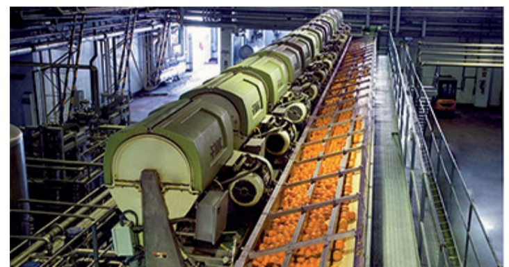
Sala de producción de zumo en Zufrisa.

Otro de los motivos que alegaba la empresa para cerrar la pro-