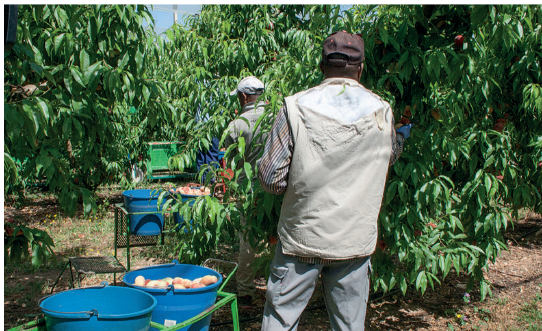
Según el Gobierno, España necesita 80.000 temporeros para las diferentes campañas de recogida.

En este contexto, el Gobierno español aprobaba el 7 de abril un Real Decreto-Ley con medidas urgentes de carácter temporal en materia de empleo agrario, con la finalidad de garantizar la disponibilidad de mano de obra para hacer frente a las necesidades de agricultores y ganaderos. Su objetivo era asegurar la recolección en las explotaciones agrarias,