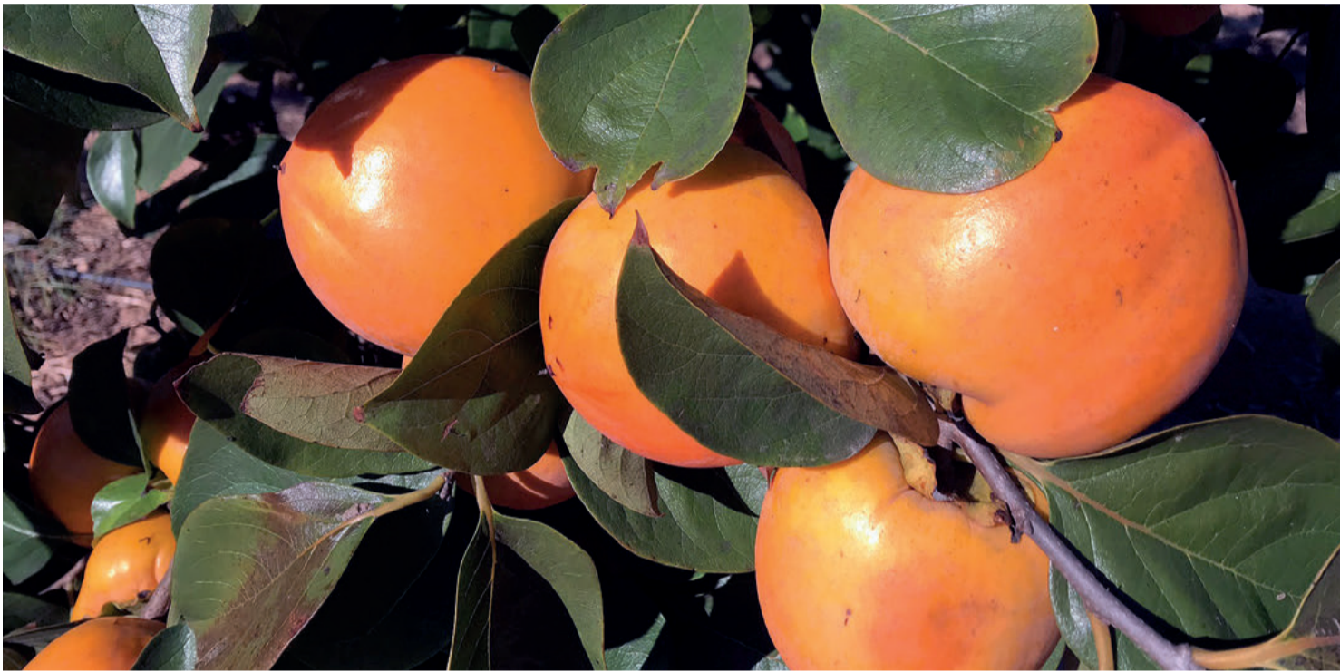
El Minagri ha aprobado los requisitos fitosanitarios necesarios para el inicio de la importación en fresco de caqui, mandarina y naranja desde España.

SEMENARIO HORTOFRUTICOLA FUNDADO EN 1962