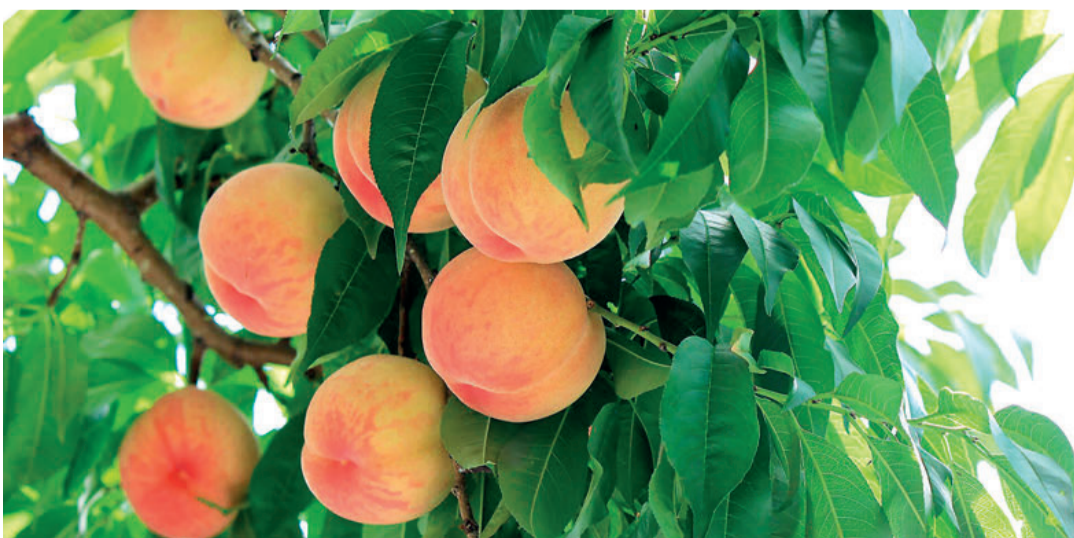
La producción europea de fruta de hueso desciende un 17% según las previsiones del Foro Européché 2020.

En cuanto a las previsiones de cosecha en Europa para melocotón, nectarina, paraguay y pavia, el foro de Européché 2020 las situó en 3.200.000 toneladas según apuntaron los representantes de España, Italia, Grecia y Francia. Esto supone un retroceso del 17% respecto a la cifra de 3.700.000 obtenida el año anterior.