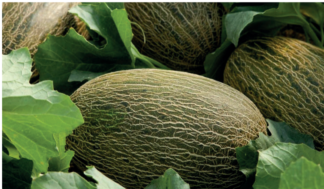
Castilla-La Mancha concluyó su temporada 2020 con 220.000 toneladas de melón, y 180.000 de sandía.

La Región de Murcia reafirma en la campaña 2020/2021 su liderazgo a nivel nacional en la producción de limón acaparando un 63% del total del conjunto