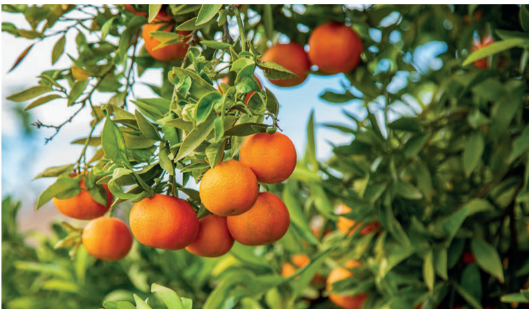
Las estimaciones reflejan un incremento de la cosecha de cítricos del 12% respecto a la campaña 2019-2020.

A pesar del descenso productivo, del notable crecimiento