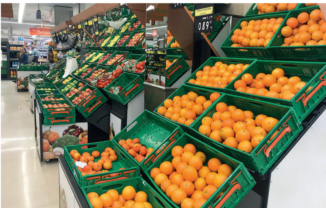
Los supermercados españoles no sufrieron desabastecimiento de productos frescos ni en los momentos más duros.

España cuenta con un sector primario fuerte, que soporta una grave crisis, pero que es capaz de garantizar la producción de alimentos y su puesta a disposición de la sociedad con la colaboración del resto de integrantes de la cadena. El sector alimentario español ha demostrado su capacidad de seguir cubriendo las necesidades de los consumidores en este escenario de crisis. Aunque la avalancha de ciudadanos a los supermercados indudablemente provocó roturas de stock puntuales —sobre todo en los primeros días tras el anuncio del estado de alarma—, los productores y las empresas comercializadoras fueron capaces de reponer los productos en cortos periodos de tiempo por la eficiencia de sus procesos logísticos y su capila-