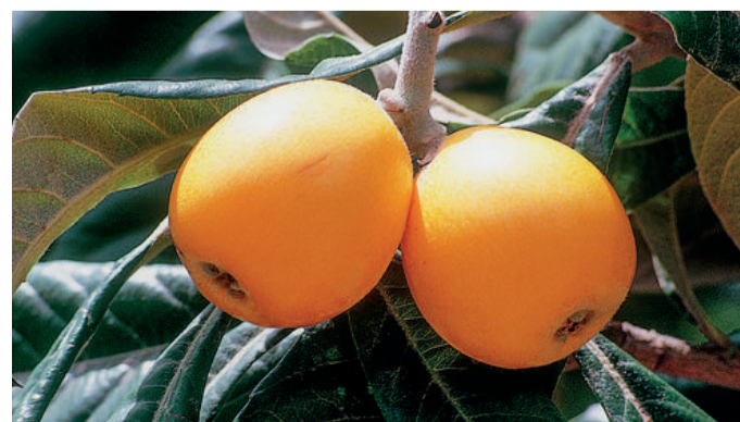
La calidad del níspero esta campaña fue excepcional.

En cuanto al fruto, las primeras previsiones confirmaban un estado cualitativo excelente, calibres satisfactorios y frutos con un sabor extraordinario. Respecto al volumen de cosecha esperado para la campaña 2020, desde la principal cooperativa productora y comercializadora de níspero de Callosa d'en