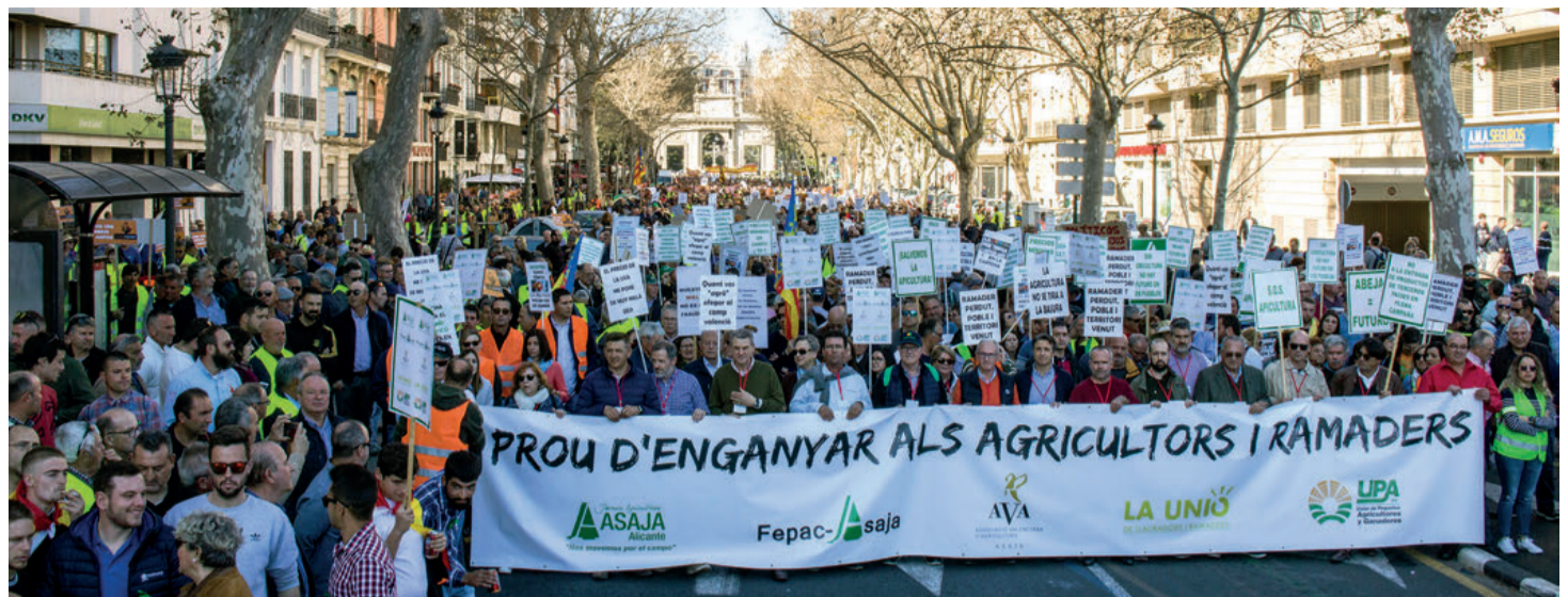
Las manifestaciones de agricultores y ganaderos se sucedieron durante el mes de febrero por distintos puntos del país.

LRS. El Brexit es una pésima noticia para toda Europa. Yo creo que es fruto del auge de los movimientos populistas que han crecido en todo el mundo, y es algo de lo que el Reino Unido se va a arrepentir. El cambio político en Estados Unidos es una buena noticia y espero que ese cambio se traduzca en más cordura en todo el panorama internacional. En todo caso, ahora espero que el Brexit se produzca con acuerdo y minimizando todo efecto negativo en las personas y en sectores económicos interdependientes, como es el agroalimentario.