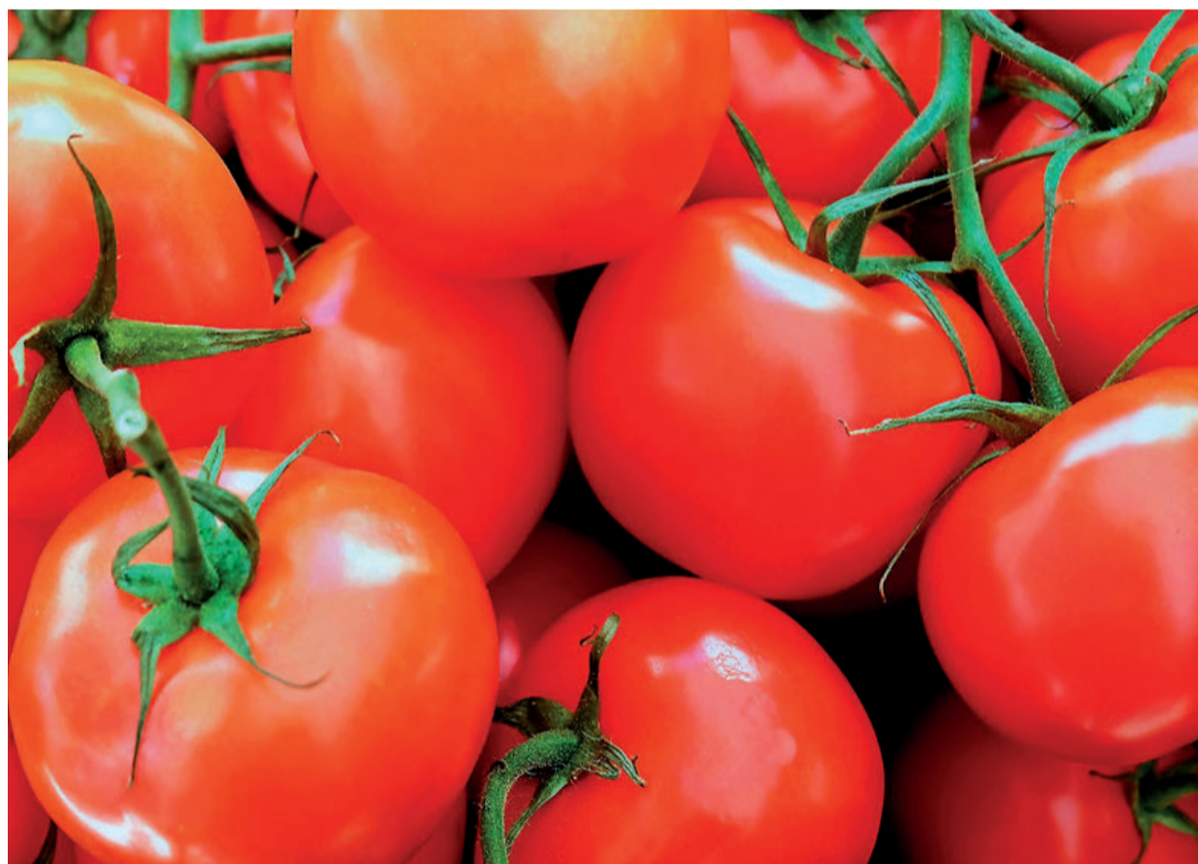
El mayor crecimiento en las importaciones de hortalizas procedentes de Marruecos corresponde al tomate.

El mayor crecimiento en las importaciones de hortalizas procedentes de Marruecos corresponde al tomate con un 28% más en volumen, sumando 52.291 toneladas, y un 39% en valor, totalizando 55 millones de euros. Esta situación preocupa al sector agrupado en Fepex, porque como se ha reiterado en múltiples ocasiones, Marruecos es un competidor directo de las producciones españolas tanto en el mercado nacional como el comunitario y la entrada de tomate a precios muy bajos genera crisis de precios periódicas, en un escenario competitivo asimétrico, puesto que las exigencias productivas,