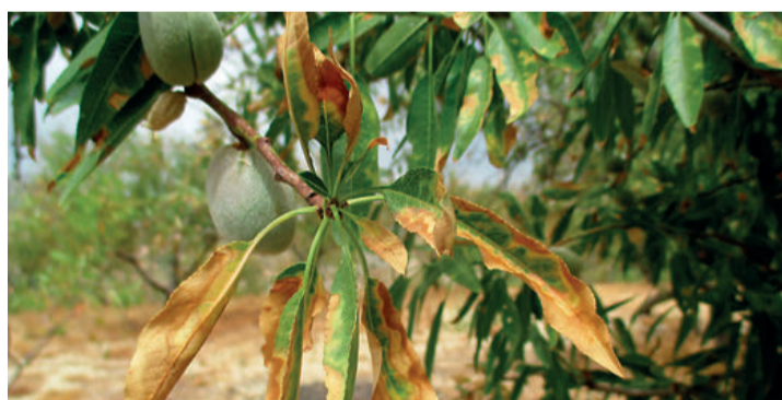
La CE pone en marcha medidas para el control de la Xylella fastidiosa.

Por países, destacaban las caídas de producción respecto a la anterior campaña de Francia (-13%), Hungría (-23%), Portugal (-15%), España (-16%), Austria (-17), mientras que Polonia, que en la temporada precedente cayó hasta un 40%, recuperaba en parte su potencial con un incremento del 17%.