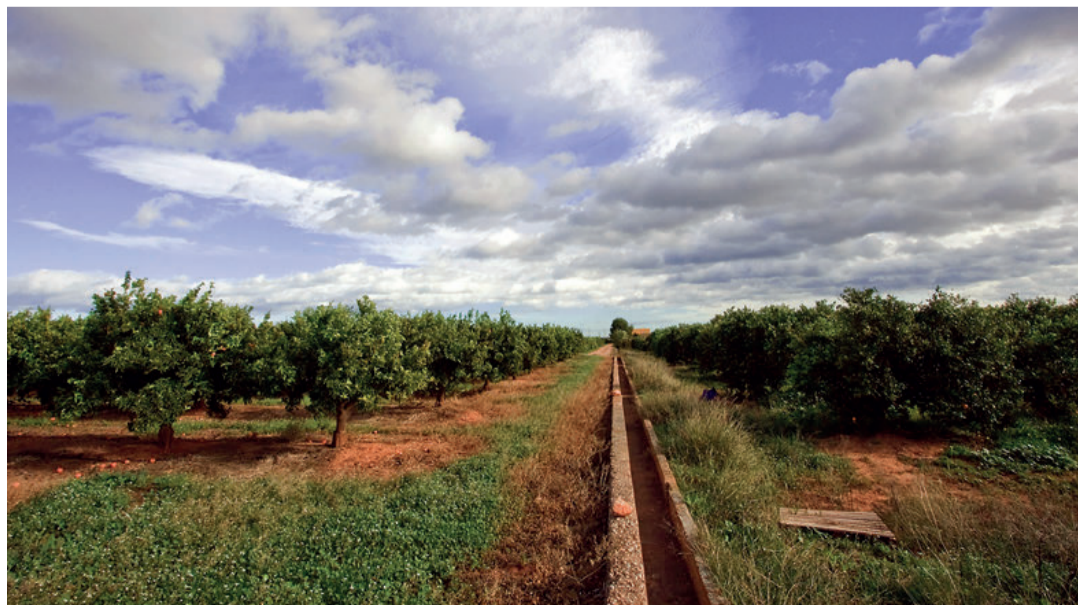
El sector agrario juega un papel estratégico en el conjunto de la economía española. / VF

“El canal online ha entrado, y parece que para quedarse, en el sector de la alimentación, y ha multiplicado por tres su cuota de mercado en este tiempo de pandemia. Esto da muchas oportunidades a nuestras pequeñas pymes agroalimentarias”