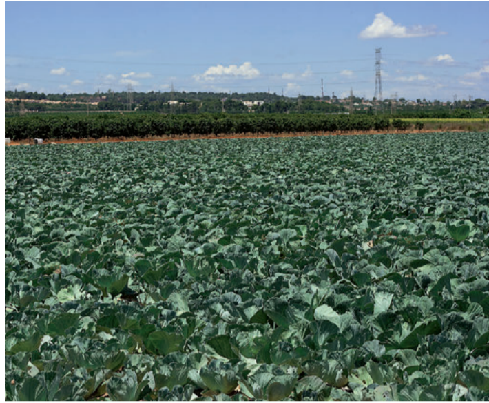
Desde Asaja seguirán defendiendo unos precios justos para los agricultores.

VF. En cuanto a la falta de agricultores jóvenes para rege-