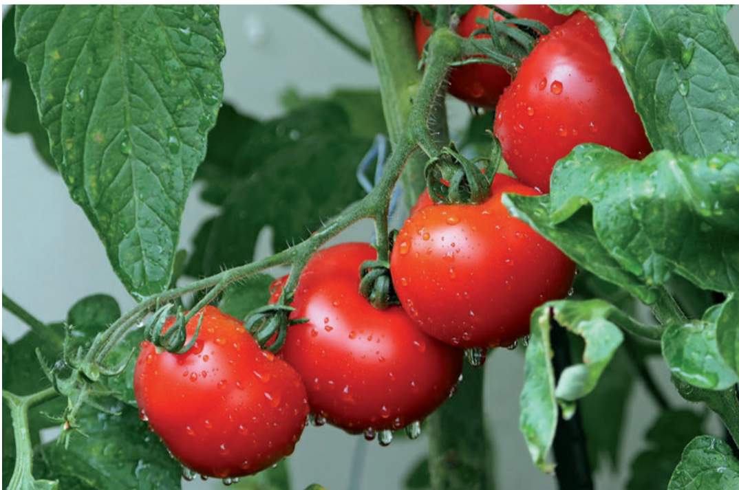
El tomate continúa su tendencia de caída en producción y se está desarrollando un trasvase hacia otros cultivos.

En un análisis más detallado por producto, el tomate continuó con su tendencia de caída en producción en la campaña 2019/2020: 8% menos respecto al ejercicio precedente, y 14% respecto a la media de los últimos 5 años. Desde Coexphal señalaron que se está desarrollando un trasvase hacia otros cultivos como consecuencia de la pérdida de rentabilidad, debida al aumento de costes, la inestabilidad de precios por la fuerte competencia, y una productividad que no despierta por la afección de plagas. De hecho, los precios también se redujeron en esta campaña un 9% respecto a la anterior. Los ingresos cayeron un 16% y el margen casi un 30%. El resultado obtenido fue bastante similar al compararlo