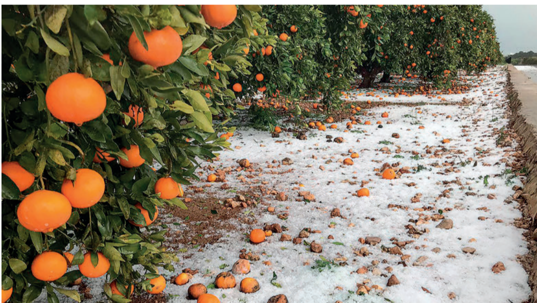
La nieve y el granizo afectaron a los cítricos pendientes de recolección.

La borrasca Gloria también provocó importantes daños a su paso por Andalucía. Una superficie de más de 1.000 hectáreas resultó afectada por el granizo en Níjar, y en 150 hectáreas las estructuras de invernaderos se vinieron abajo. Málaga tampoco no se libró de los efectos del temporal. Por ejemplo, en el término municipal de Coín se registraron precipitaciones por encima de los 211 litros por metro cuadrados y las primeras estimaciones apuntaban que el temporal dejó incomunicadas un total de 20 instalaciones ganaderas y causó incidencias también en explotaciones que cultivan cítricos y frutas tropicales. Gloria también se ensañó con el litoral catalán, que sufrió la peor tormenta de levante de este siglo. El temporal engulló el Delta del Ebro, dejando algunas de sus zonas más sensibles completamente inundadas por el mar, que cubrió 3.000 hectáreas de arrozales y penetró 3 kilómetros tierra adentro. Y en Aragón, el temporal de nieve afectó a 3.767 kilómetros de carreteras y a 143 municipios