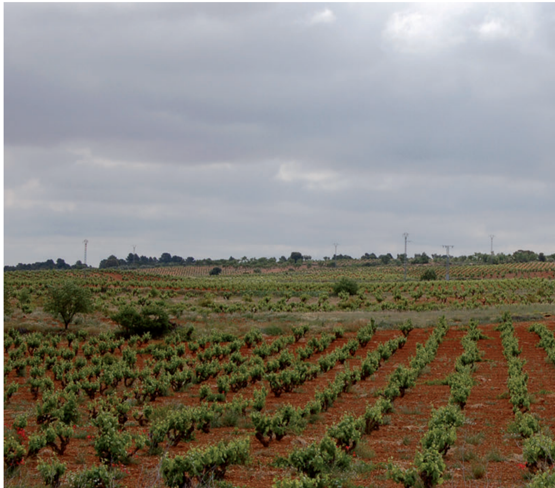
Desde COAG, su secretario general señala que las razones y reivindicaciones del sector agrario, que se echó a la calle de forma masiva durante siete semanas del pasado enero y febrero, "siguen igual de vigentes".

Además, se deben abordar un abanico de actuaciones en lo que concierne a los costes de producción, cuya tendencia al alza ha reducido la rentabilidad del sector los últimos lustros. En este aspecto es imprescindible apoyar inversiones para reducir la dependencia energética de las ex-