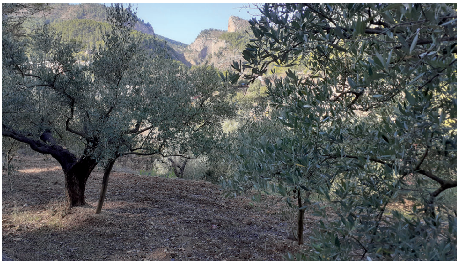
El gran reto de la nueva PAC debe ser la preservación y fortalecimiento de un modelo agrícola que tenga en cuenta a agricultores y agricultoras.

MB. Nuestro objetivo como organización es situar al sector agrario como protagonista y no sujeto pasivo de la revolución tecnológica, que condiciona nuestro presente y determinará en el futuro toda la actividad socioeconómica, también la agroalimentaria. Desde COAG impulsamos iniciativas como el Foro ‘DATA-GRI’ porque los hombres y mujeres del campo nos dedicamos a producir alimentos y queremos seguir haciéndolo en el futuro. Y para que esto sea posible es absolutamente necesario democratizar y socializar los nuevos procesos de transformación