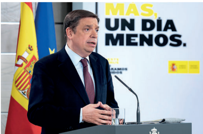
El ministro Planas analizó en Valencia Fruits el comportamiento del sector.

La nueva campaña de fruta de hueso, que dio su pistoletazo de salida en el mes de mayo, comenzaba con mejores cotizaciones, una disponibilidad de producto al consumidor más temprano que en la temporada anterior y un ritmo de salidas desde las centrales fluido, según los datos del Ministerio de Agricultura.