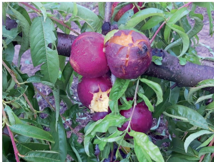
Imagen del estado de la fruta tras la intensa granizada.

La sectorial de cítricos de La Unió de Llauradors realizaba en junio un balance de la campaña de cítricos 2019-2020 que estaba a punto de concluir. A pesar del sensible aumento en las cotizaciones percibidas por los productores (más de un 80% de media), sus ingresos únicamente subieron un 20% en la relación a la pasada debido al gran descenso de cosecha. Así pues, La Unió calificó la campaña como "atípica" y con muchos "altibajos". El precio medio de la campaña 19/20 fue de 0,41 euros/kg por los 0,23 euros/kg de la pasada, lo que significa un 82% más. Por su parte, los ingresos de los citricultores en la pasada temporada ascendieron a 841,22 millones/euros, frente a los 701,55 de la anterior, que supone un incremento del 20%. Al final, la diferencia entre la producción estimada en relación a la producción finalmente comercializada de la anterior fue un 17% inferior. La organización