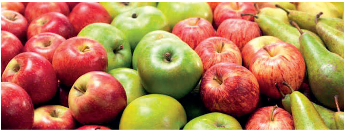
A pesar del descenso en el volumen de la producción europea de manzana y pera, las perspectivas de comercialización eran positivas según Afrucat.

La exportación española de frutas y hortalizas en el primer semestre de 2020 descendió un 3,5% en volumen pero creció un 9,5% en valor con relación al mismo periodo de 2019. Los envíos hortofrutícolas se saldaron con 7,2 millones de toneladas y 8.564 millones de euros. En este periodo, los meses de mayo y junio reflejaron fuertes descensos del volumen. Por otra parte, las importaciones tuvieron un fuerte incremento tanto en volumen (+4,83%), con 1.772.594 toneladas, como en valor (+8,92%), con algo más de 1.677 millones de €.