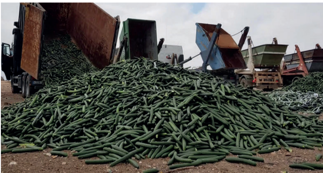
El sector decidió retirar pepino del mercado para intentar frenar la fuerte crisis de precios de este producto.

Los representantes de las organizaciones del sector de la producción y comercialización volvieron a poner sobre la mesa la necesidad urgente de un control de los acuerdos con terceros países como Marruecos y la mayor transparencia posible sobre importaciones, cupos y lo que se está controlando en las fronteras. Finalmente, insistieron en que hay que mejorar los mecanismos de retiradas para que estos lleguen al conjunto del sector.