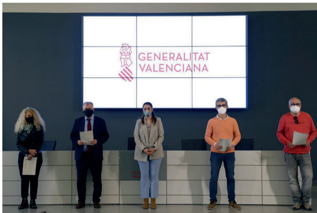
Tras dos días de negociaciones se alcanzó un acuerdo para desconvocar la huelga en los almacenes de cítricos.