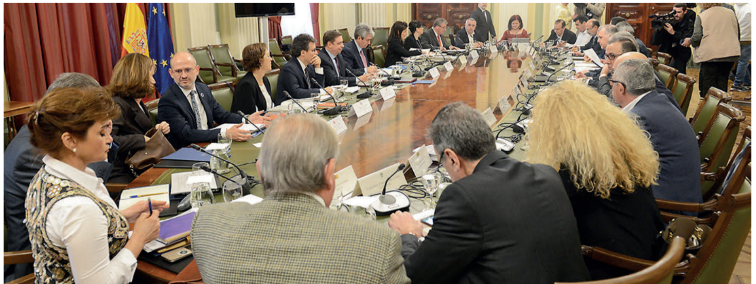
Luis Planas organizó reuniones con representantes de los diferentes eslabones de la cadena agroalimentaria. /VF

del total. Se trata de una previsión que se realiza a principio de cada anualidad, en función de los programas operativos aprobados por las comunidades autónomas, por lo que la ayuda final será aproximadamente del 80%-85% de dicha cifra. En la presente anualidad 2020 la solicitud de ayuda prevista se incrementa un 4% respecto a 2019 y un 19% respecto a la media de los 5 últimos años. Las beneficiarias serían 470 organizaciones de productores repartidas en 15 comunidades autónomas destacando Andalucía, Murcia, Comunidad Valenciana, Cataluña, Aragón y Extremadura. España es el segundo Estado miembro receptor de estas ayudas con el 25% del total de la Unión Europea tras Italia, una ayuda que ha seguido una evolución al alza desde su creación en 1997.