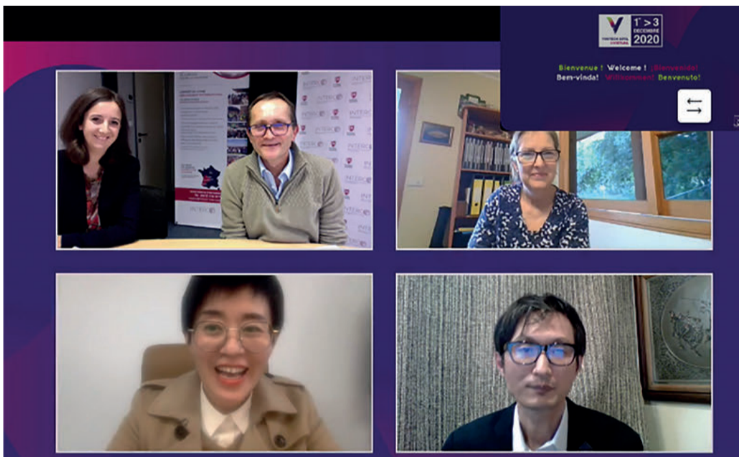
Jornada para analizar la situación del sector de la castaña en los diferentes países del mundo.

Los representantes de Estados Unidos y Chile enviaron videos donde explicaron un panorama bastante similar. En Chile, la producción es limitada, ronda las 500 toneladas, pero se espera llegar a las 1000 toneladas en los próximos años. La misma tendencia sigue Estados Unidos, cuya producción está creciendo y cuenta con 300 hectáreas destinadas al fruto. En cuanto a China, Japón y Australia, sus intervenciones se retransmitieron en directo.