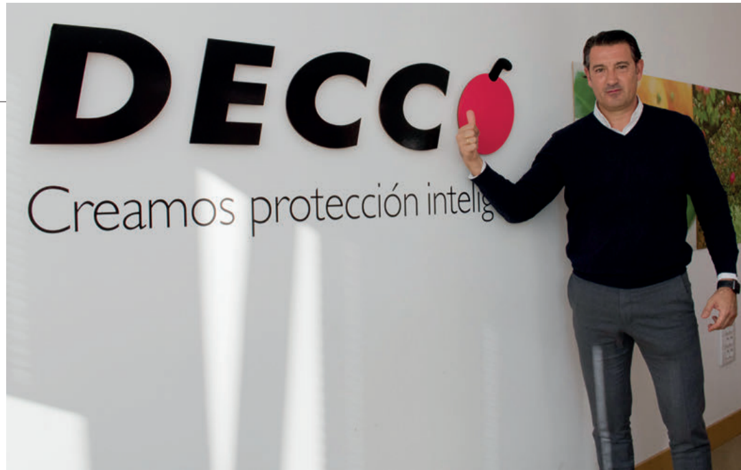
La sede de Decco en Paterna va a tener que adaptar sus instalaciones a las nuevas necesidades.

FJRN. Este año Decco ha incrementado su plantilla y, a nivel