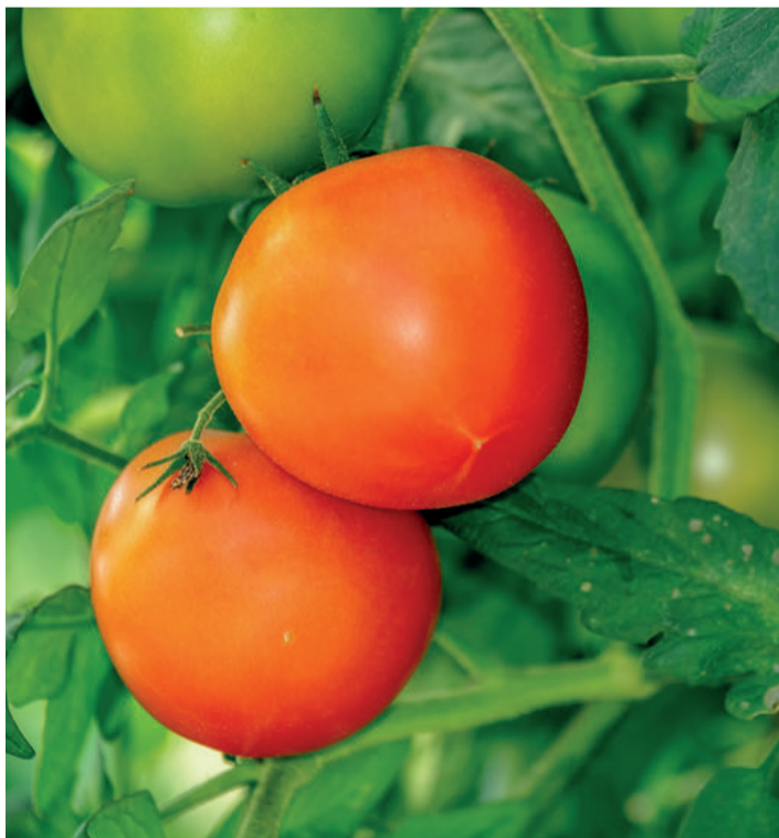
Todos los tipos de tomate registraron en el inicio del mes de diciembre valores inferiores a los obtenidos en las dos campañas precedentes.

El incremento de las cotizaciones hortícolas ha estado motivado, fundamentalmente, por la reducción de la oferta y por un incremento de la exportación