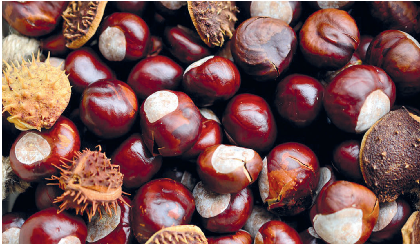
El crecimiento de la industria de la castaña se está viendo condicionado por el cambio climático y las enfermedades que afectan a este cultivo.