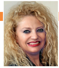
Por INMACULADA SANFELIU (*)

Prácticamente la mitad de toda la cabaña ganadera en Brasil se encuentra dentro de la Amazonia legal, con más de 106 millones de cabezas de ganado,