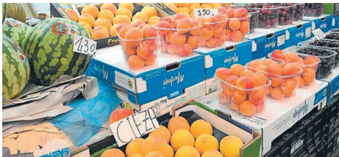
Aunque en los lineales la fruta se ha vendido bien y a precios mejores que en 2021, los productores no lo han notado. / AM

Por último, el consumo de melocotón y nectarina en fresco crecerá en la UE en 2022 un 3%, pasando de 5,9 kilos per cápita en 2021 a 6,1 kilos per cápita este año, a pesar de que el poder adquisitivo de los consumidores europeos es menor. Esto supone una cierta recuperación, pero esta cifra es un 5% menor a la media del consumo de los últimos cinco años. El crecimiento