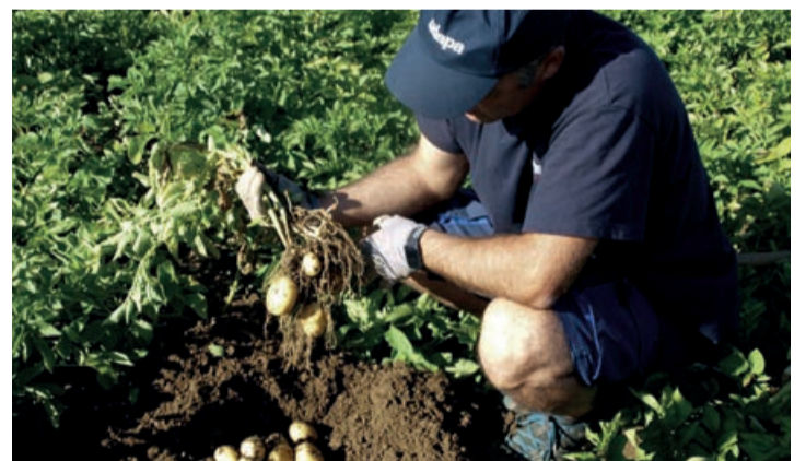
Udapa ha comenzado ya a recolectar sus primeras patatas de Álava.

Fiel a su carácter innovador, la cooperativa ha plantado 2 hectáreas de boniatos a modo de prueba para comprobar si el cultivo de esta papa dulce es factible en tierras alavesas. “Nuestro principal objetivo es aprender de este cultivo, ver cómo se adapta a nuestro suelo y a las condiciones climatológi-