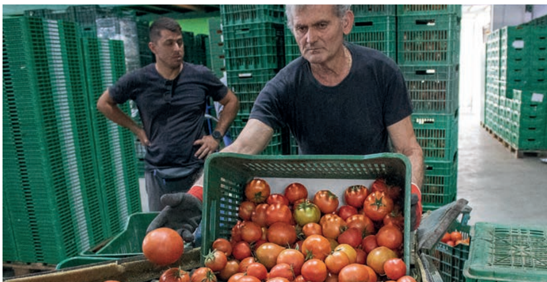
La cooperativa Kamiros pone en el mercado 4.000 toneladas de tomate, pimiento, pepino y berenjena.

Creta es la principal zona productora de hortalizas de Grecia y cuenta con aproximadamente 2.200 hectáreas de invernaderos