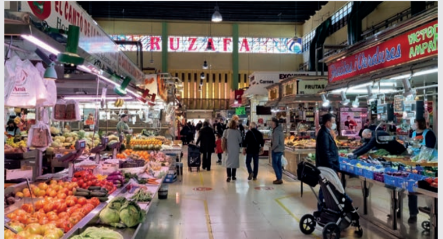
La guerra en Ucrania ha hecho desaparecer las esperanzas del final del aumento de la inflación./ NR

De hecho, los mandatarios europeos se escudan en el Fondo Monetario Internacional que pide a los bancos centrales que suban los intereses para poner coto a la inflación mientras el BCE anuncia que subirá incluso más de lo previsto. Lo subraya, Isabel Schnabel, miembro del comité ejecutivo del BCE, que ha pedido a los bancos centrales que actúen "con