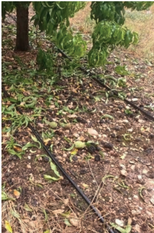
El granizo afectó al melocotón de Calanda.

En los cultivos herbáceos se estiman daños por valor de 15,2 millones, los seguros pe-