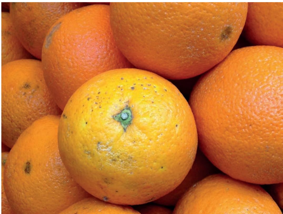
La UE obliga a los exportadores sudafricanos a realizar un tratamiento en frío a las naranjas.

Ante la situación creada en los puertos de entrada de la UE por las naranjas llegadas desde Sudáfrica con posterioridad al 14 de julio, desde el Comité de Gestión de Cítricos, Inmaculada