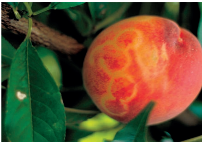
Confirmada la detección de sharka en unos melocotoneros en la Vall de Albaida.