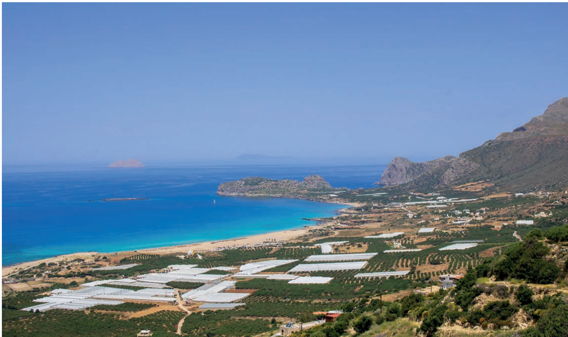
Los invernaderos se extienden cercanos a las costas de Creta bañadas por las aguas cristalinas del mar Mediterráneo.