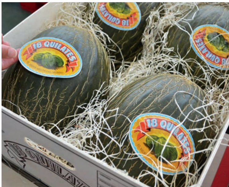
La marca de melones '18 Quilates' es la más antigua de España.