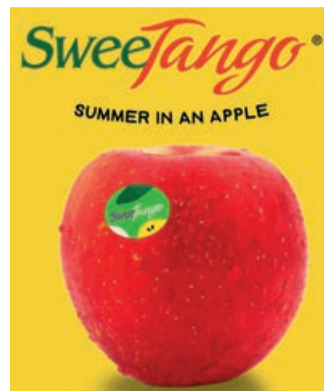
Una marca distintiva y reconocible. / ST

Pero la idea más impactante de esta temporada la ha tenido Alemania, donde se encuentra uno de los productores más importantes. Es un reto: "Crunch the world record apple", un concurso que durará varias