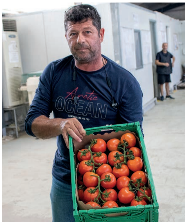
El tomate es el producto estrella de la cooperativa Nótos Fresh.

La Cooperativa Koudoura fue fundada en 1999 y actualmente cuenta con 30 agricultores asociados y 20 hectáreas de invernaderos. Su cifra de producción total asciende a 2.050 toneladas, de las que un 70% corresponde a tomate, un 21% a pimientos, un 6% a berenjena y un bajo porcentaje a pepino. Un 70% del producto se comercializa en el mercado nacional y un 30% se destina a la exportación, con Bulgaria y Serbia como principales destinos. Casi toda su producción se gestiona a través de los supermercados.