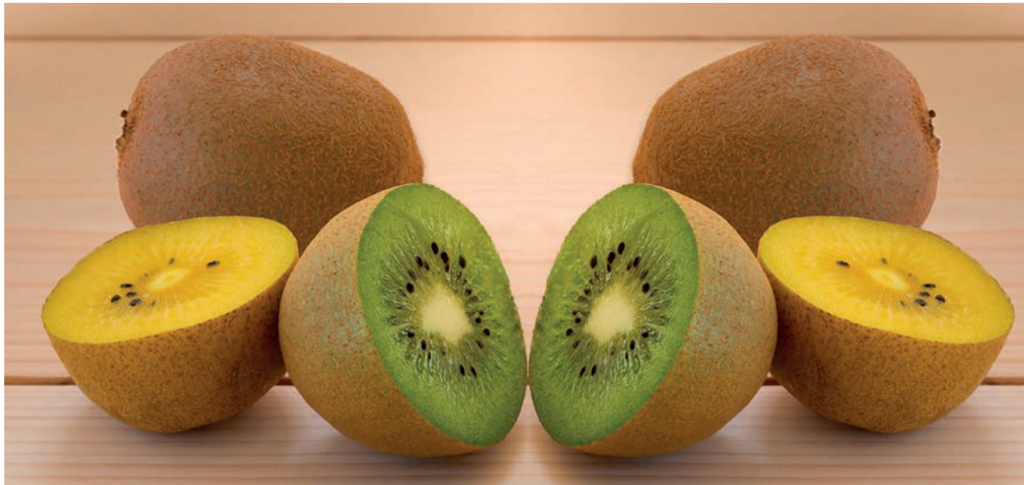
El kiwi es uno de los productos hortofrutícolas más importantes del comercio agroalimentario mundial, con un crecimiento significativo en valor y volumen. / ARCHIVO