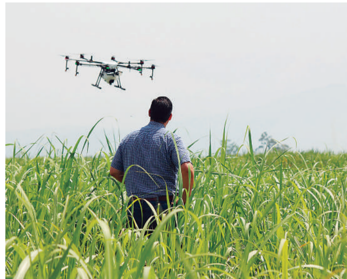
La campaña se enmarca en el proyecto “Ecosistema de Innovación Agro”. / VF

proyectos y finalmente, AgroBank incluye en su nueva etapa el AgroTech, para acompañar y facilitar a los clientes su transición hacia un agro del futuro.