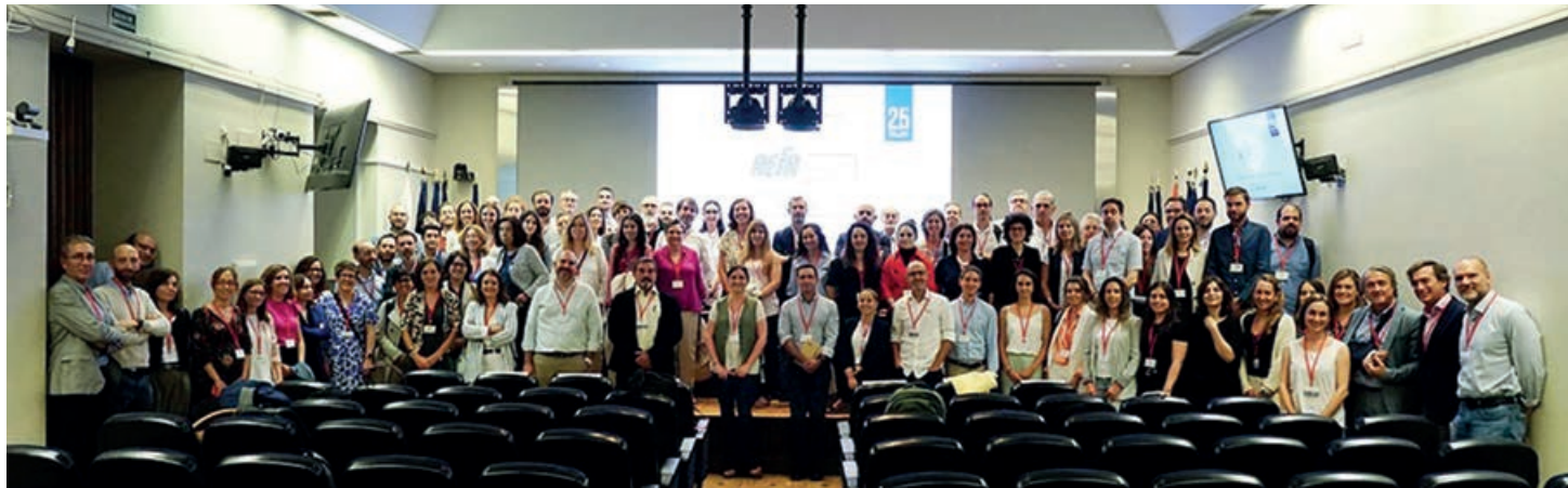
Tras la clausura, ponentes y asistentes intercambiaron impresiones respecto al mundo de los fertilizantes, su regulación y sostenibilidad en la Agricultura.