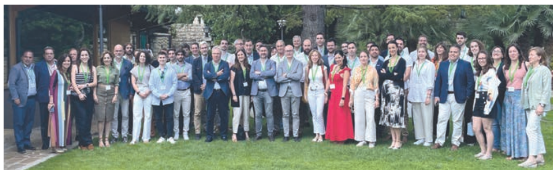
Gracias a este programa, una élite de ingenieros agrónomos se está incorporando a las empresas del sector.

Gracias a este programa, una élite de ingenieros agrónomos se está incorporando a las empresas del sector pioneras a nivel mundial.