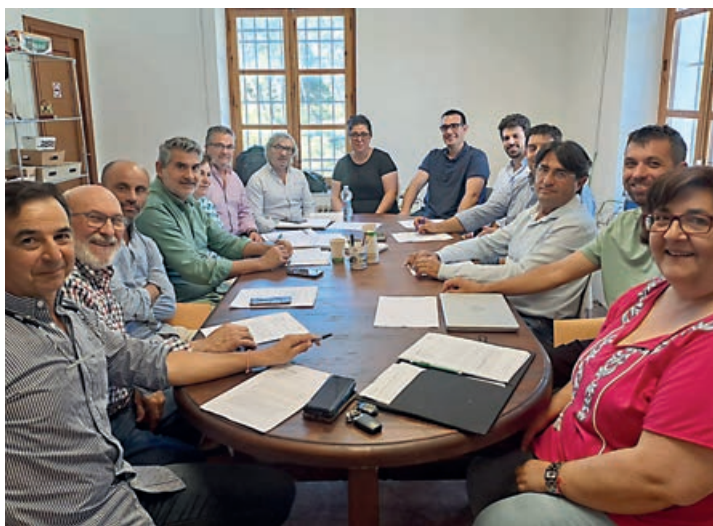
Imagen de la reunión del sector de la cereza alicantina celebrada la semana pasada.

Unas medidas que ya han sido trasladadas a la consellera de Agricultura en funciones, Isaura Navarro, en una reunión solicitada por la IGP para tal fin.