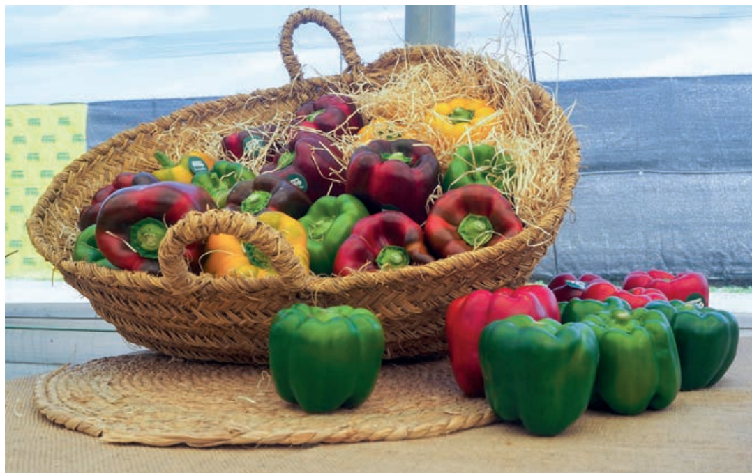
El pimiento murciano es una producción estacional con un calendario de marzo a agosto.

En su cuarto año de colaboración, la actividad ha consistido en un PressTrip en el que han participado 13 periodistas de