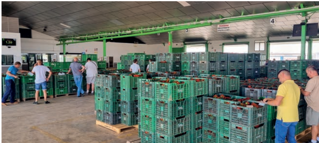
Subasta de pimientos en Agrodolores, un modelo de venta muy extendido en el Campo de Cartagena.

características comerciales. Es un proceso largo y laborioso que puede durar como mínimo 10 años, más tres o cuatro años para desarrollarla a nivel productivo”.