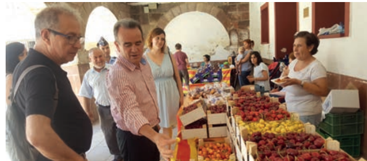
Feria de la cereza de El Frasno (Zaragoza).

Recientemente la Asociación para la Promoción de la Cereza de la Comunidad de Calatayud y Comarca del Aranda ha dado un paso más con la aprobación