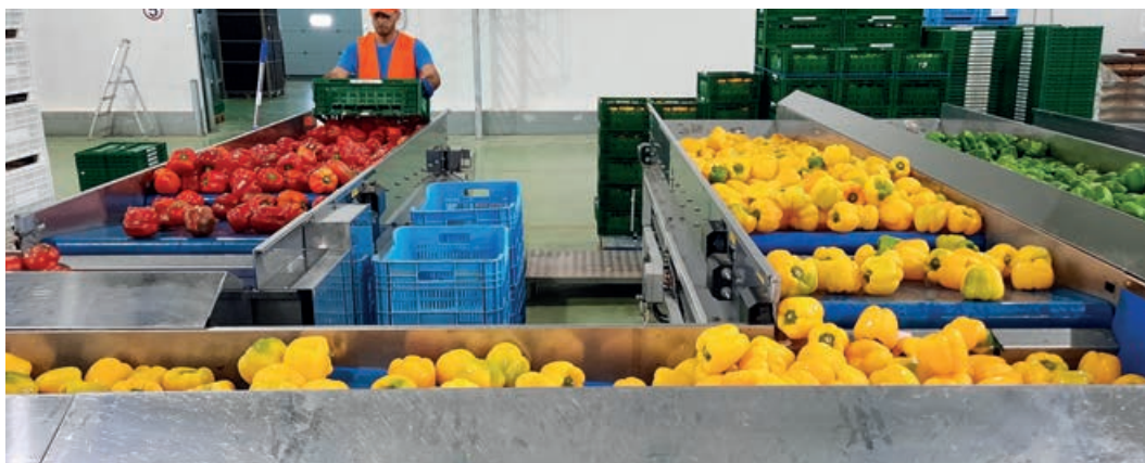
La recepción y volcado es el primer paso cuando los pimientos llegan a las centrales hortofrutícolas.

El consejero también los animó a seguir trabajando en estas líneas de investigación de mejora genética que tendrán continuidad, pues forman parte de uno de los ejes estratégicos de los nuevos programas de I+D+i que llevará a cabo el IMIDA durante el periodo 2021-2027, financiados con fondos FEDER (Fondo Europeo de Desarrollo Regional (FEDER) y cofinanciados por el Gobierno regional.