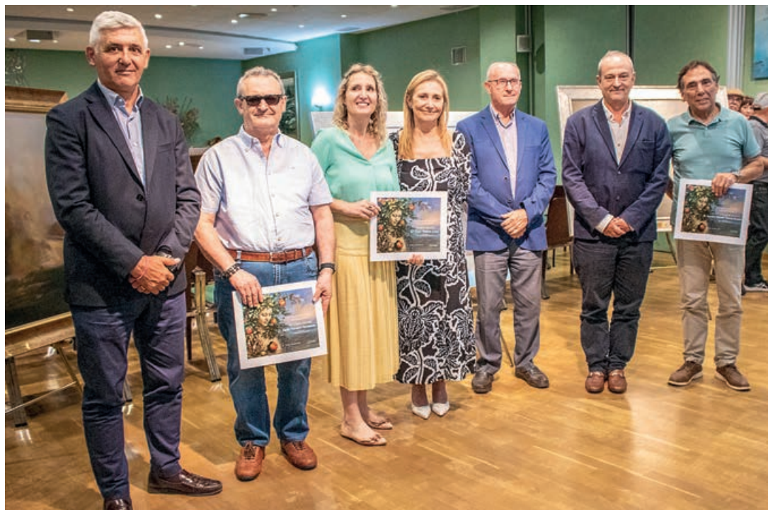
Foto de familia de los premiados en la 23ª edición del Certamen de Pintura y Periodismo de FUVAMA. / ÓSCAR ORZANCO