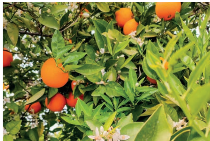
Almería representa un 10 por ciento de la producción total de cítricos de Andalucía, donde dentro de esa producción provincial, la naranja dulce representa un 54 por ciento de la producción.

Otro factor determinante para el desarrollo de la campaña ha sido, al igual que en resto de sectores, el fuerte incremento de los costes de producción. En este caso, los costes energéticos, en insumos, combustible y sobre todo en el agua, sitúa este aumento general para el sector cítrico