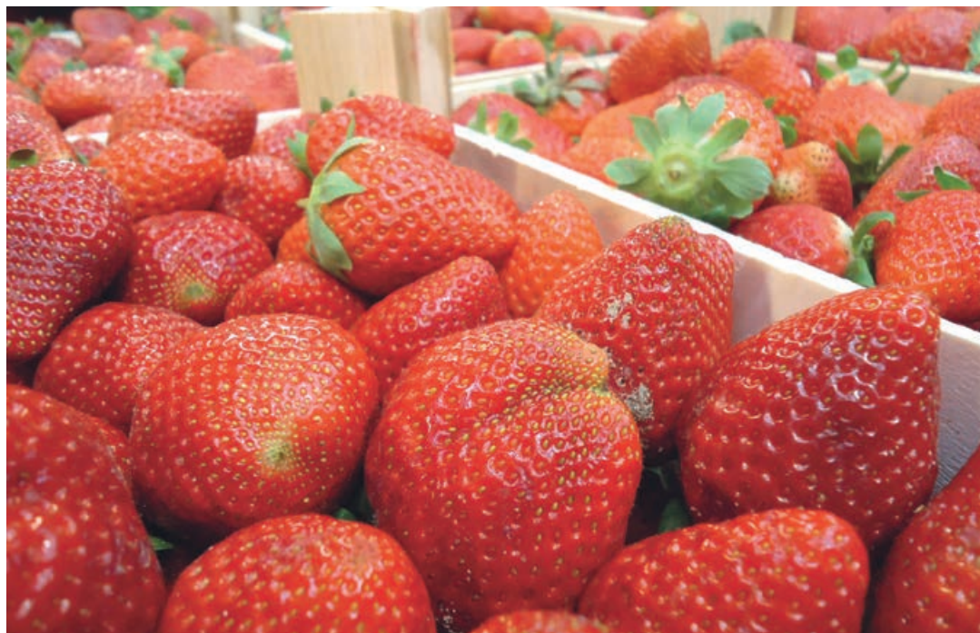
El ministro de Agricultura, Luis Planas, afirmó que el Gobierno hará todo cuanto esté en su mano para contribuir a que el sector de los frutos rojos se mantenga y mejore sus niveles de producción.

Los freseros de Huelva, por su parte, quieren ser más “proactivos” en comunicación para “poner en valor todo” lo que hacen, “no ir a remolque” y evitar en el futuro más acciones de boicot como la que acaban de