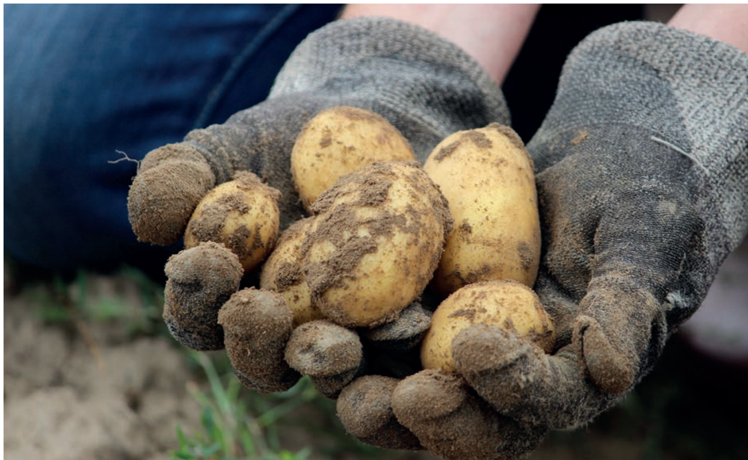
La patata se sitúa como uno de los cinco productos que más se han encarecido durante el transcurso del último año.

SEMENARIO HORTOFRUTICOLA FUNDADO EN 1962