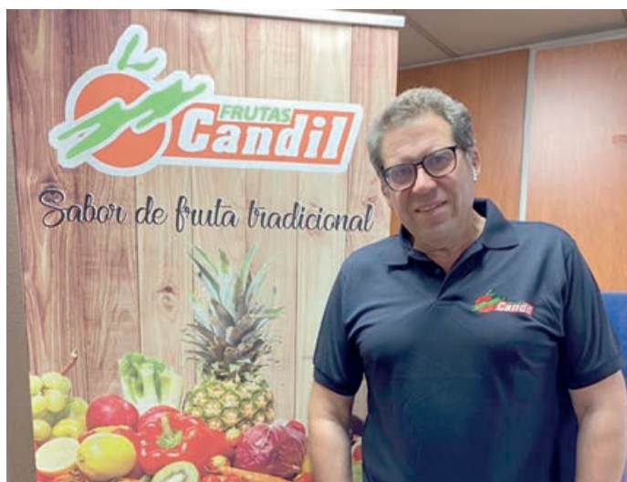
Candil afirma que, muchas veces, deben sacrificar y ajustar su beneficio para que el mercado no sufra las diferencias comerciales.

VF. Y esta apuesta por estar presente en los dos grandes mercados centrales españoles, Mercamadrid y Mercabarna, ¿a qué se debe?