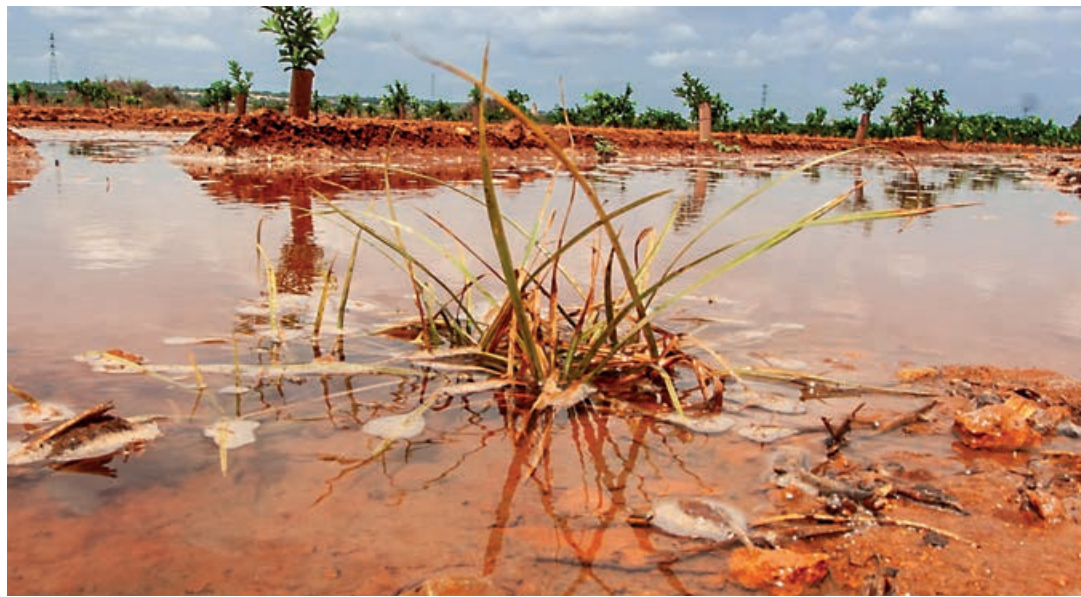
Las intensas lluvias han dejado su huella en los campos españoles.

Desde el inicio del mes de mayo, y sólo por pedrisco, los productores han comunicado siniestros en más de 110.000 hectáreas de hasta 47 provincias. Si se añaden los daños por lluvia, viento o inundaciones, la superficie total siniestrada supera las 150.000 hectáreas.