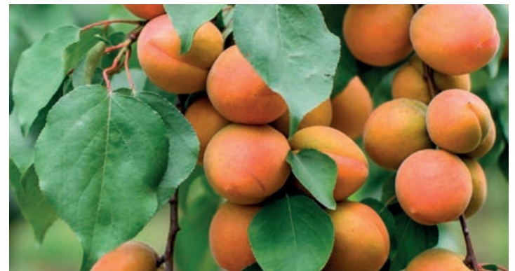
El albaricoque acumula dos campañas con mermas de producción.