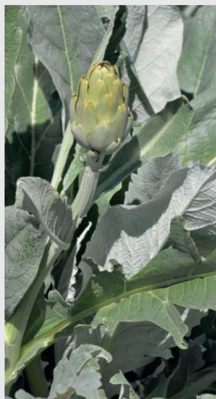
Huerta de Valencia.

Los biotecnólogos y agricultores anuncian el inicio de una nueva generación agronómica de nuevos 'superalimentos' biofortificados que comenzará en las explotaciones de cítricos valencianos y se extenderá a otros muchos productos de la milenaria huerta valenciana.