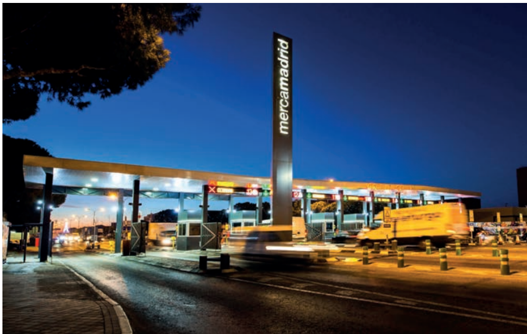
Mercamadrid cuenta con seis naves de frutas y hortalizas y una de maduración de plátanos.

MM. Con una comercialización que supera los 2 millones de toneladas de frutas y hortalizas en 2022, no hay duda de que el Mercado de Frutas y Hortalizas de Mercamadrid sigue posicionado a la cabeza de los mercados de Europa y como un importante referente en el mundo. Cuenta con seis naves de frutas y hortalizas y una de maduración de plátanos.