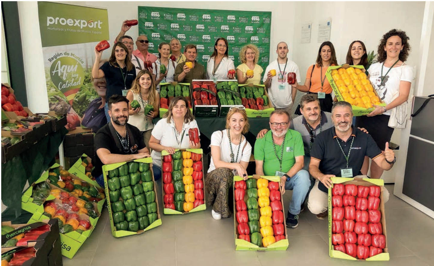
La foto de familia de los periodistas invitados por Semillas Fitó y Proexport junto con los anfitriones de este press trip 'Vitáminate con pimiento'.