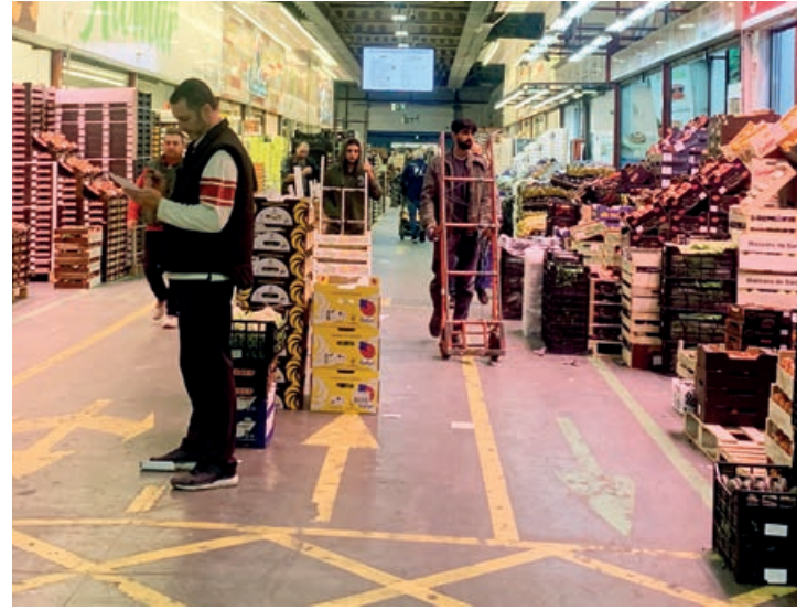
La comercialización de frutas y hortalizas registró un descenso del 4,8% en 2022 debido al cierre de un operador de la unidad alimentaria.

ción de este sector, con un descenso del 4,8%. Por su parte, la comercialización en el sector de pescados cayó un 5,2%.