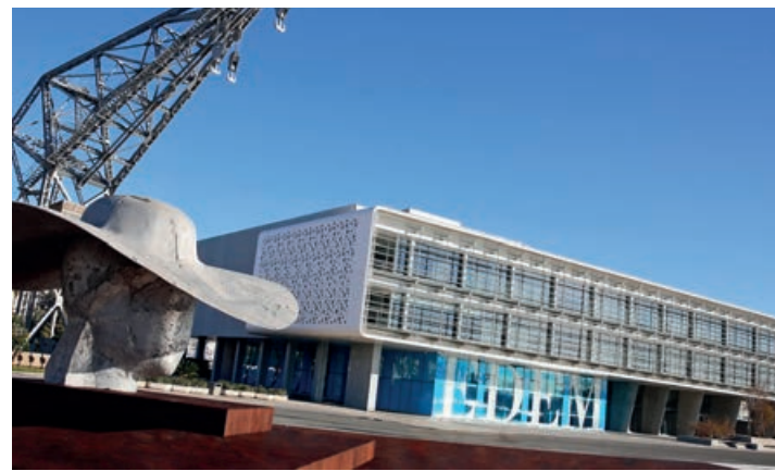
El curso está dirigido a empresarios, consejeros y altos directivos.

Ambas partes coincidieron en reconocer que el convenio marco de colaboración que se ha firmado abre las puertas a todas aquellas iniciativas conjuntas que se estimen necesarias para que Anecoop, con el apoyo técnico de Koppert, pueda ofrecer a sus productores socios nuevas herramientas de gestión de plagas que permitan obtener producciones con valor añadido para el agricultor y con calidad y seguridad para el consumidor.