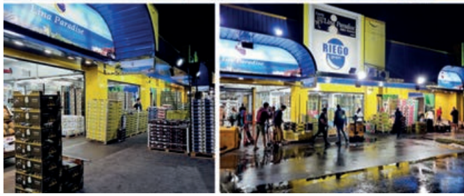
Grupo Riego lleva desde 1990 produciendo plátanos en las Islas Canarias.

cambiado mucho las cosas. Los horarios nocturnos carecen de sentido y conciliación familiar en el siglo XXI, sin hablar del despilfarro energético de la iluminación nocturna, con los altísimos costes poco competitivos que supone. También hay que tener en cuenta los precios de arrendamiento, no adaptados a la realidad del área industrial de Madrid, y la excesiva concentración de oferta de producto, por la situación geográfica de la ciudad. Todo esto hace que sea muy atractivo para los compradores y mucho menos para las empresas vendedoras. La actividad logística casi supera la del mayorismo, siendo este quien sostiene el mercado. Vemos como ya van abriendo su actividad empresas fuera del mercado, con horarios y ventajas diferentes para sus clientes, sobre todo de otros orígenes, no españolas, que aparentemente parecen el futuro del sector y que no se adaptan a la dureza de la noche, sumado a todo el día en la tienda. Por supuesto Mercamadrid tiene muchos alicientes y ventajas que se han demostrado sobradamente en la etapa de la pandemia.