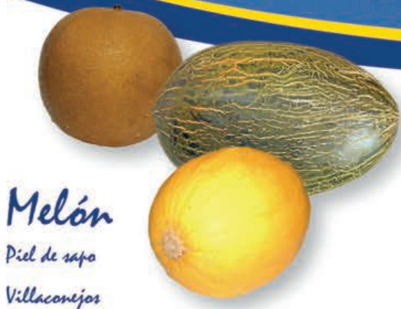
Melón Piel de sapo Villacañeros