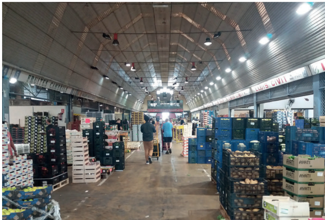
Las obras de rehabilitación ya empiezan a dar resultados tanto a nivel visual como en la mejorar de servicios.

VF. Nos encontramos a finales de junio, ¿qué esperan con-