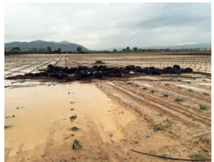
Se espera que la inundación tenga un menor impacto en la fruta.

Las últimas lluvias van a ayudar al engorde de la aceituna, y también beneficiarán a los cereales, como el trigo, avena o cebada, ya que supone “jugo” para su siembra, así como a la