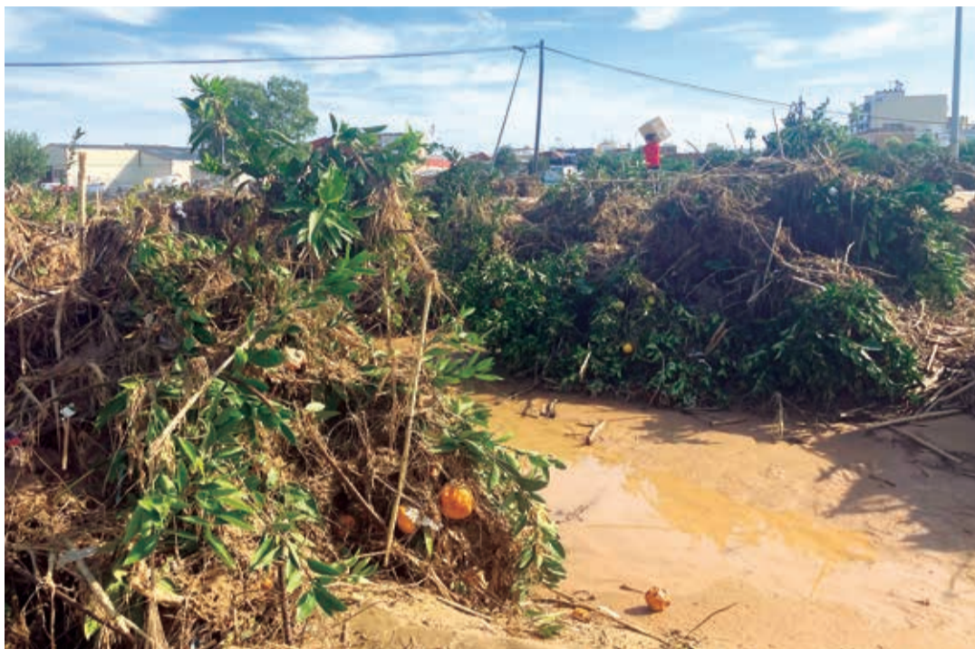
Todas las parcelas agrícolas de Algemesí se han visto afectadas por el desbordamiento del río Magro. / JULIA LUZ

El director general de Agroseguro también ha querido mandar un mensaje de tranquilidad a los agricultores y ganaderos afectados, “sabemos que muchos agricultores aún no han podido llegar a sus parcelas, de hecho, sólo hemos recibido un 30% de los partes de las 50.000 parcelas afectadas, por eso, aunque los contratos de seguro establecen un plazo de 7 días para reportar siniestros, dada la excepcionalidad de la situación, aceptaremos las notificaciones incluso si se envían más tarde”. “Atenderemos todos los casos y realizaremos el pago de las indemnizaciones en cuanto finalicen las tasaciones, lo más rápido posible”, ha puntualizado de Andrés.