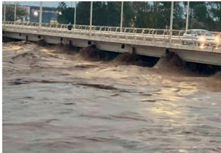
A las dos horas de tomar esta imagen el río se desbordó en Carlet y llegó a entrar en algunas casas.

Cuando colapsó la presa de Tous funcionaron los sistemas de avisos y el número de víctimas, algunos por imprudencias, 'sólo' fue de 38. Se inundó media comarca de la Ribera con grandes núcleos de población, afectó a más de 150.000 personas que tuvieron que refugiarse en primeros y segundos pisos. Cuando se acabó el problema se realizaron