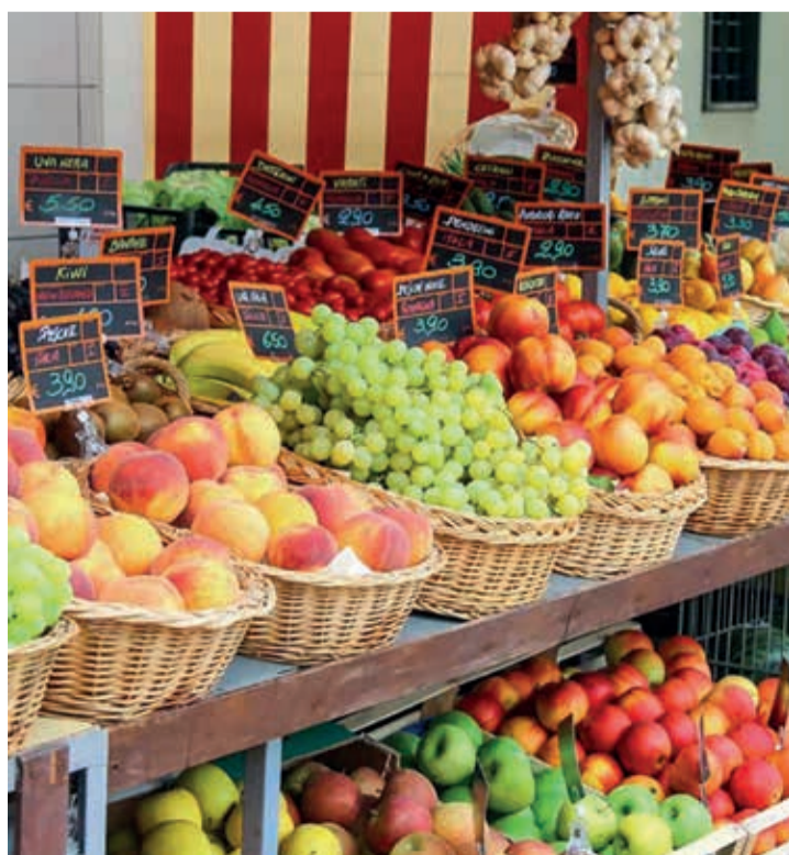
Se verifica la creciente preferencia por productos de proximidad.

Los minoristas de alimentación adaptan su oferta de productos a las cambiantes preferencias de los consumidores italianos, ampliando la gama de productos cultivados localmente, pero también las alternativas étnicas, veganas y vegetarianas, los productos "sin" (sin gluten, lactosa o azúcar) y los "superalimentos". Un factor clave en el futuro del sector minorista italiano será el declive de los pequeños ultramarinos locales que operan en el mercado. Este vacío en el mercado se llenará probablemente con la expansión de las cadenas de supermercados y la compra online. Además, dado el rápido envejecimiento de la población italiana, se espera que la proximidad y la comodidad sean un factor cada vez más importante a la hora de elegir dónde y cómo hacer la compra, y que las personas mayores en particular prefieran estar más cerca de casa.