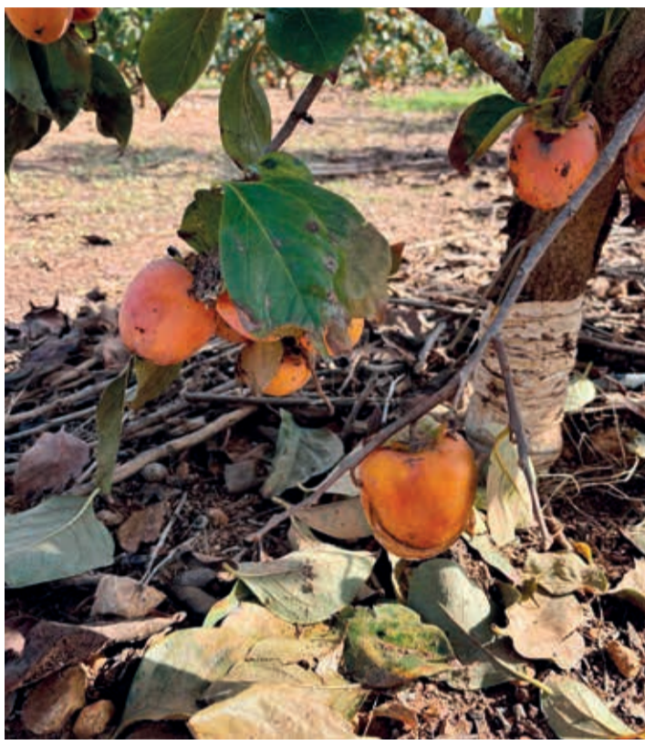
La DANA ha provocado importantes pérdidas en el cultivo del kaki.

En cuanto a las coberturas de los seguros agrícolas, Prats señala que "las pólizas no cubren todos los daños que se han producido. En las pérdidas provocadas por pedrisco no hay problema, pero respecto a las provocadas por inundaciones o en infraestructuras la cobertura es escasa. Por ello, estamos analizando alternativas y qué tipo de ayudas podemos solicitar, y consideramos que los seguros deberían tener una cobertura más adecuada para este tipo de contingencias".