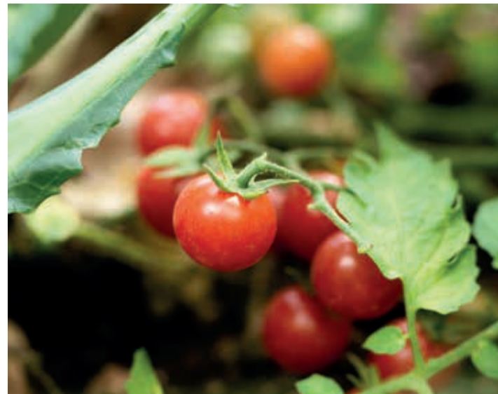
En 2024 la demanda de tomate en los hogares españoles se recupera.

De enero a junio de 2024 el consumo de tomate en los hogares se ha situado en 265 millones de kilos