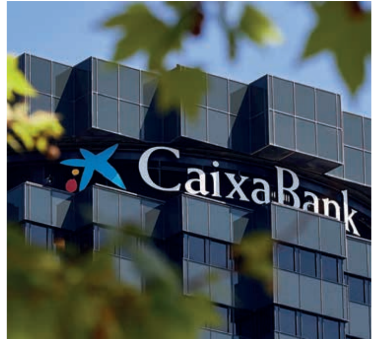
Para los afectados se habilitará una línea de financiación al 0% para sus necesidades inmediatas.

CaixaBank también ha impulsado nuevas líneas de financiación para la recuperación de las empresas de la Comunitat Valenciana y de Castilla-La Mancha que hayan sufrido daños, con