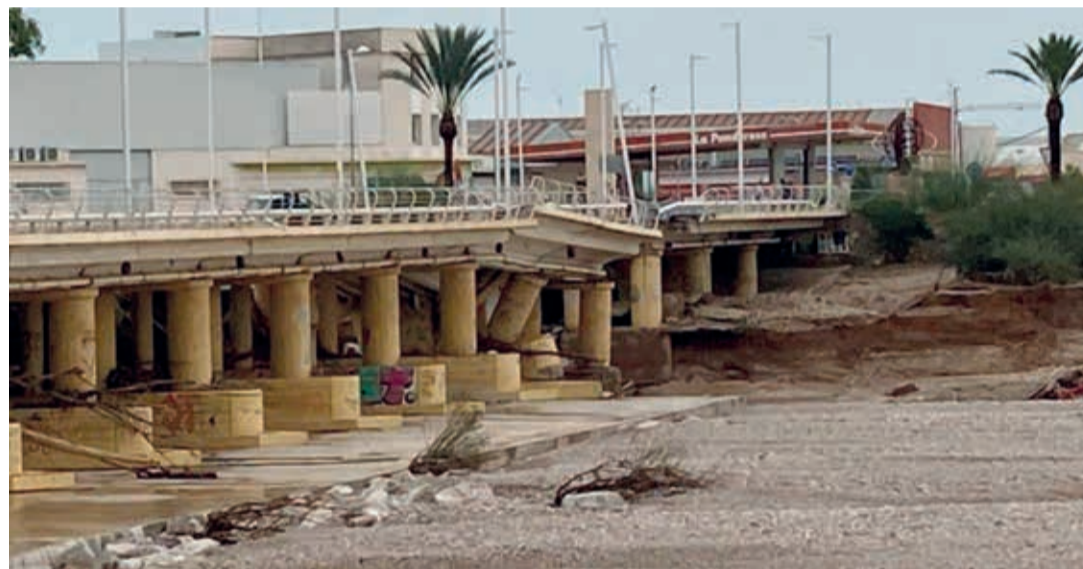
Imagen del mismo río a las 36 horas de tomar la primera foto.

toda una serie de obras que han hecho mucho más segura la vida de esas poblaciones.