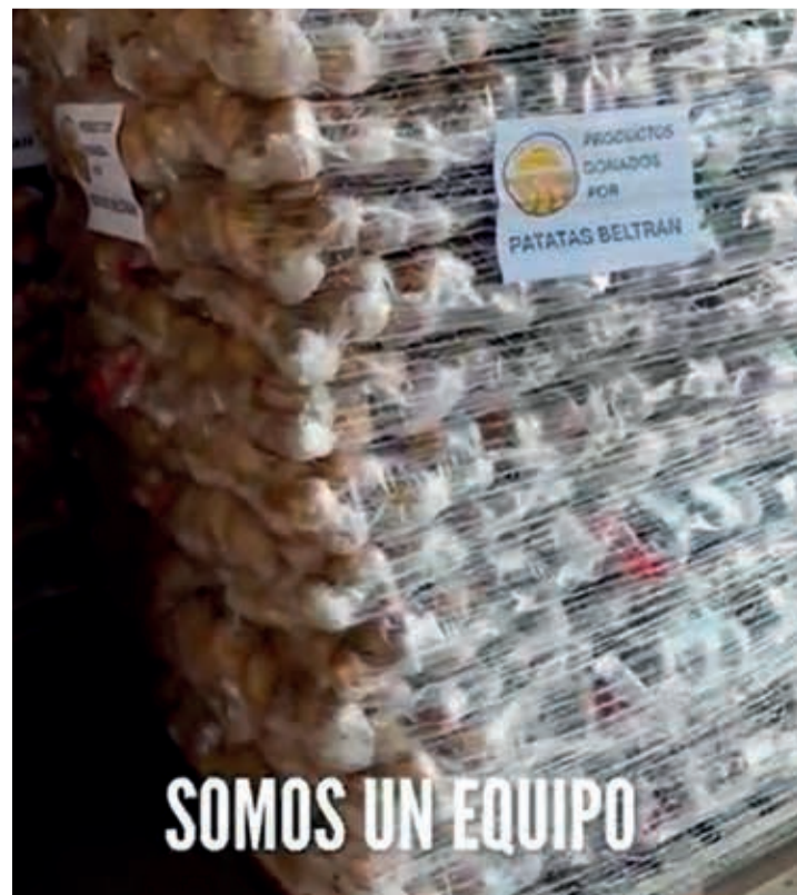
Uno de los muchos palets de patatas que ha donado Patatas Beltrán.

población local y a los miles de voluntarios que se han desplazado a los municipios más afectados por la DANA, coordinándose con otros cocineros valencianos como Quique Dacosta. En este caso muchas de las patatas de los miles de platos de comida de caliente que se reparten cada día proceden de esta empresa que se ha volcado en la ayuda con los habitantes de los municipios devastados por esta riada: "Nuestras patatas van a dar de comer a todos los voluntarios y a todos los especialistas y gente que lo necesita en Valencia", relatan desde Patatas Beltrán, muy implicados en la ayuda en esta catástrofe.