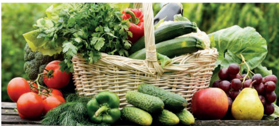
Las hortalizas exportadas, entre septiembre de 2023 y agosto de 2024, se han cifrado en 2.713.926 toneladas.

En las hortalizas de invierno, la campaña 2023-2024 estuvo marcada en su inicio por unas elevadas temperaturas, que obligaron a replantaciones y al retraso de la comercialización, y por una alta incidencia de plagas y enfermedades. A pesar de estas circunstancias, la campaña 2023/24 de hortalizas de invernadero finalizó con una producción de 4.291.692 toneladas, un 2,6% más que la anterior.