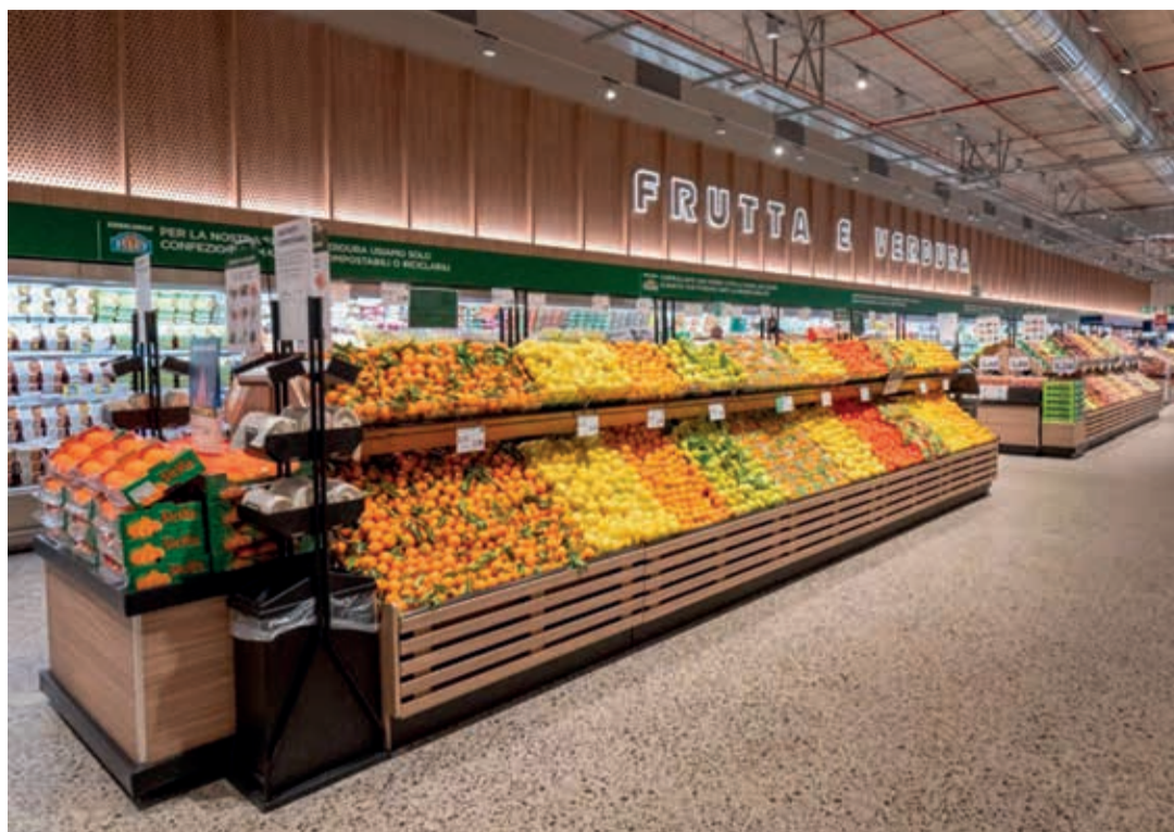
Conad, Esselunga SpA, Coop Italia, Selex Gruppo Commerciale SpA, Crai Secom SpA, Gruppo VèGè, Carrefour Italia y Spar Internacional son los principales minoristas de alimentación en Italia.

Hipermercados, supermercados, tiendas de conveniencia, de descuento y especializadas coexisten con las tradicionales tiendas de barrio y los mercados al aire libre en Italia