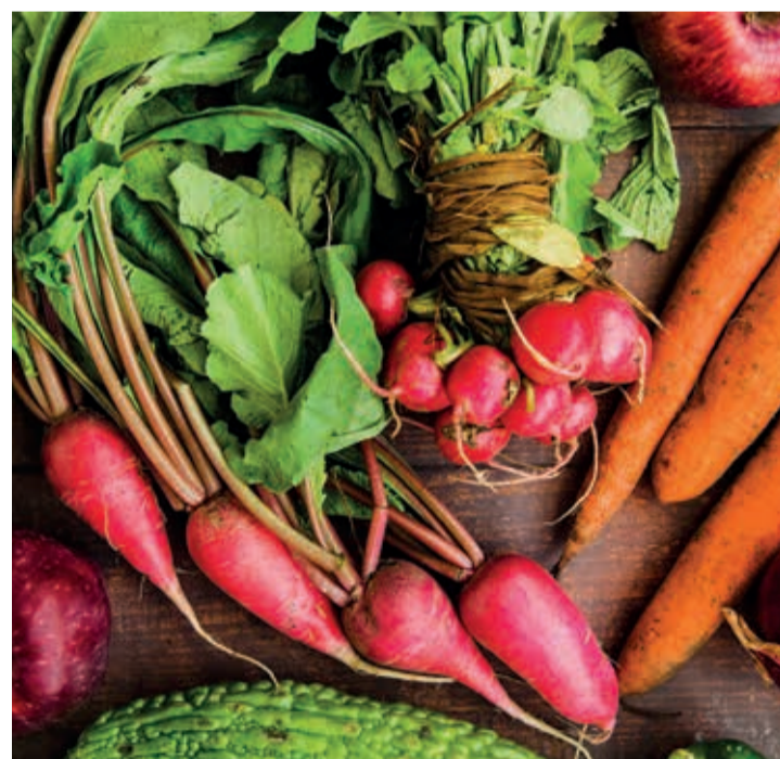
Se espera que la producción se incremente de cara al invierno.

En cuanto a la berenjena larga/negra, Hortyfruta ha activado, desde el 18 de octubre de 2024, la prohibición de comercializar la II categoría de la berenjena larga/negra como parte de la Extensión de Norma de Calidad aprobada en julio de 2022. Esta medida busca asegurar que sólo berenjenas que cumplan con estrictos estándares de calidad lleguen al mercado, reforzando la competitividad del sector.