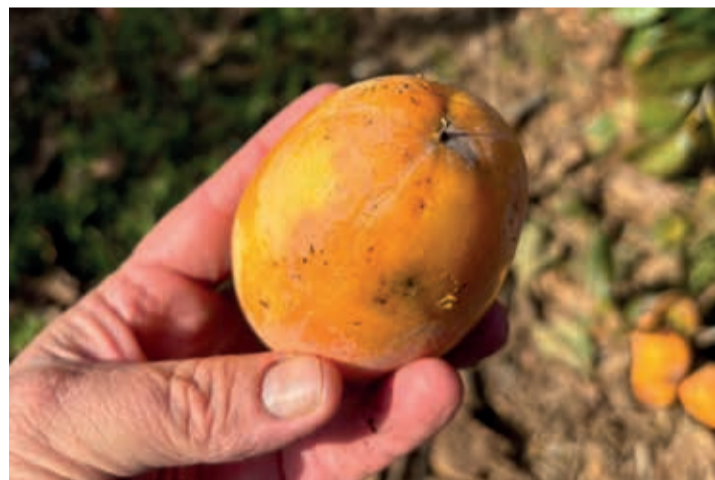
Con las importantes pérdidas de cosecha, desde el sector avanzan que será complicado llegar a Navidad con producto en el mercado.

La merma de cosecha generará un ligero incremento en los precios, según Prats, pero en ningún caso "compensarán las pérdidas sufridas por la DANA"