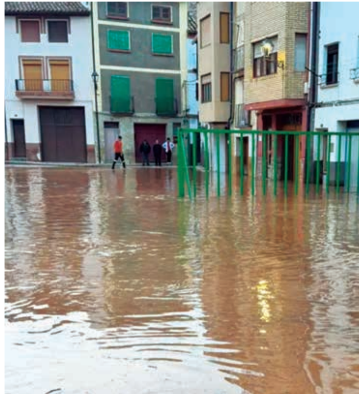
El río Turia se desbordó a su paso por el pueblo de Libros (Teruel).

El Ebro contará con un área irremediable de 354 hectáreas repartida en 14 zonas entre las localidades zaragozanas de Osera