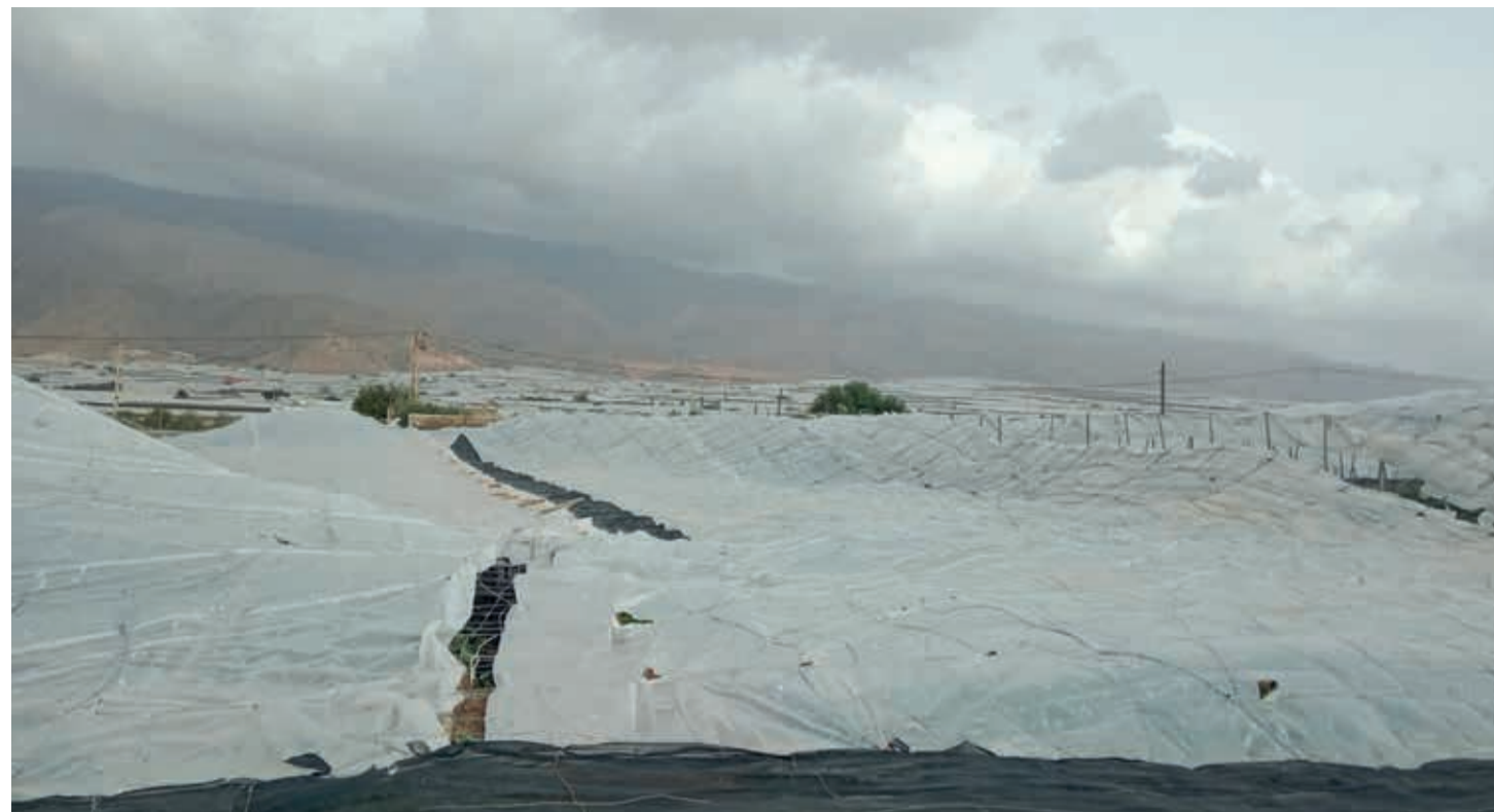
Desde las organizaciones agrarias esperan que se active la declaración de zona afectada gravemente por emergencia de Protección Civil.

En un comunicado, Iglesias afirma que el granizo destrozó los plásticos y las estructuras de los invernaderos y rompió las plantas de los cultivos que están ahora mismo en plantación, como son tomates, pimientos, calabacines y pepinos, y asegura que la situación en la comarca del Poniente almeriense es “dantesca”.