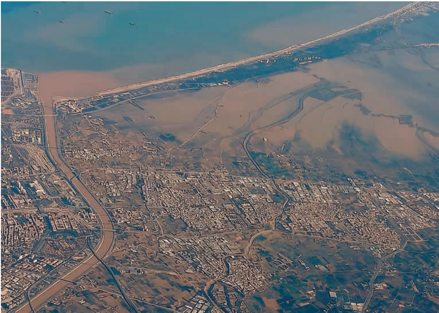
El paso de la devastadora DANA anegó de agua y barro muchos municipios de la provincia de Valencia dejando un enorme rastro de destrucción.

SEMANARIO HORTOFRUTICOLA FUNDADO EN 1962