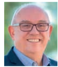
Por PACO BORRÁS (*)

350 y 649 litros por metros cuadrado en 12 horas, con momentos puntuales máximos de 150 litros en una hora, se convirtió en un mar enloquecido. Esto era a las 17.30 horas del mar-