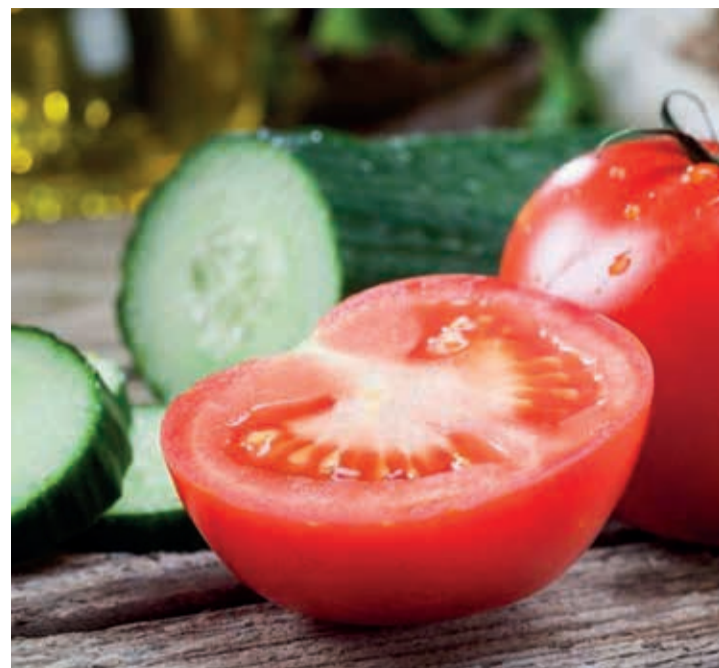
Destaca el incremento que ha registrado el tomate con un 4,5%.

En términos de comercio exterior, las cifras extraídas de Eurostat reflejan un volumen de exportaciones, entre septiembre de 2023 y agosto de 2024, de 2.713.926 toneladas, un 4,3% más