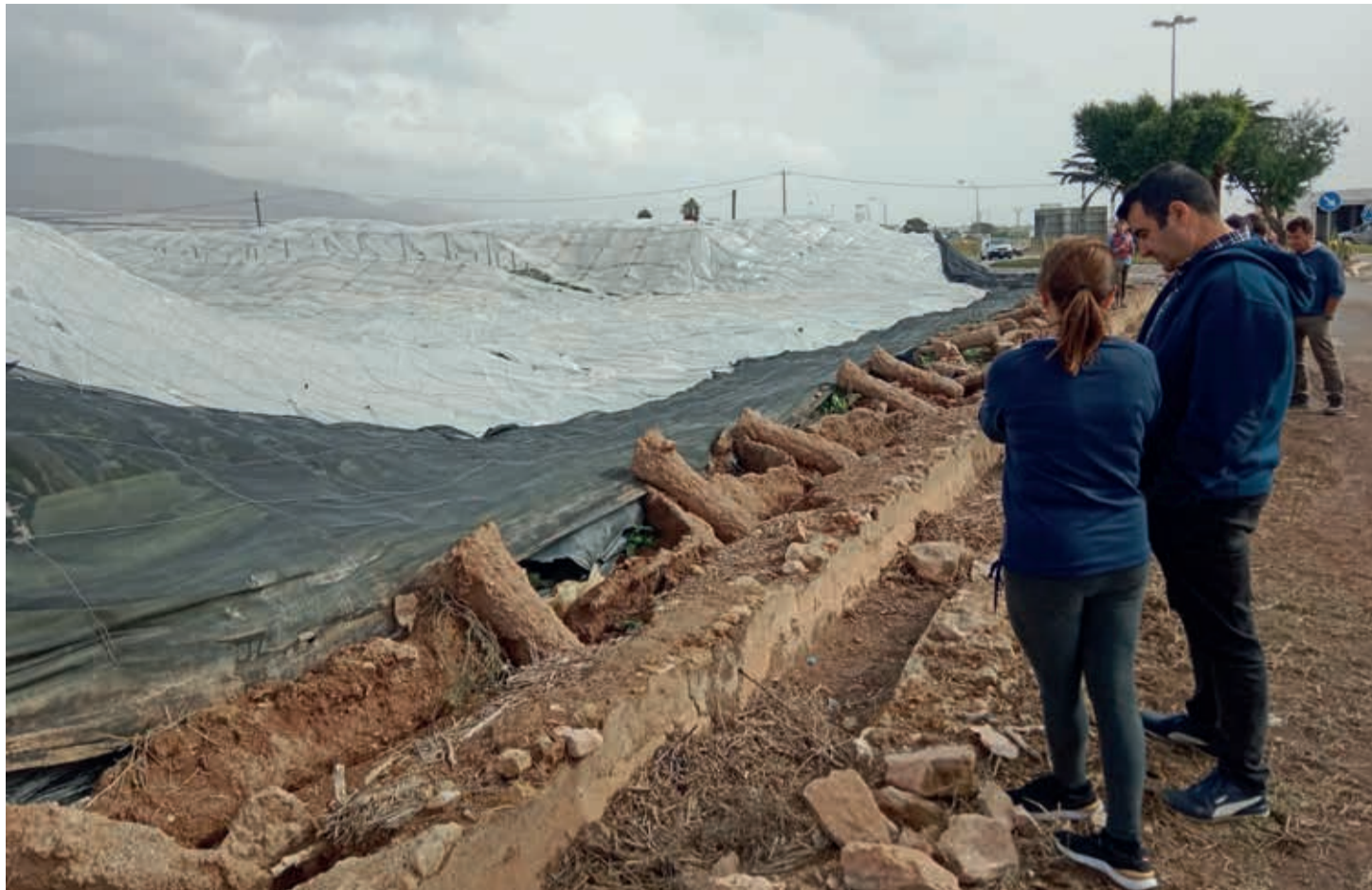
Los daños ocasionados por la granizada ascienden a 158.661.000 euros en el sector agrario.