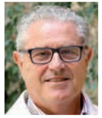
Por CIRILO ARNANDIS (*)