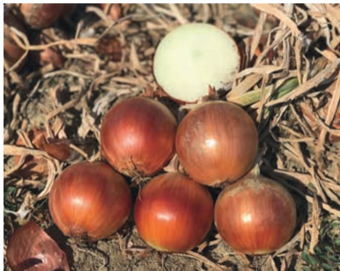
Imagen de la cebolla Magika F1, híbrido de ciclo medio temprano.

En cuanto a Stemphylium vesicarium, en 2018 iniciamos un programa de mejora genética para abordar este grave patógeno que está afectando al cultivo de la cebolla en los últimos años, con el objetivo de permitir a los productores obtener un producto cada vez mejor y tener una buena cosecha a pesar de todos los problemas causados por el estrés y las enfermedades fúngicas.