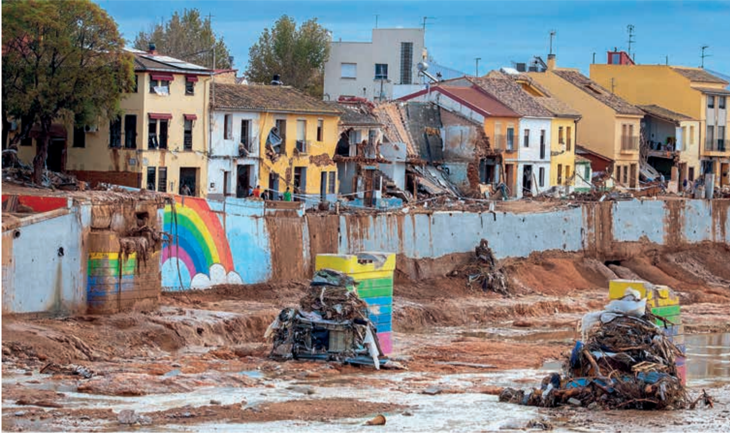
El paso de la DANA ha dejado tragedia y devastación en numerosas localidades valencianas.

No siempre es fácil ponerse a escribir esta tribuna de opinión, pues en ocasiones no hay temas de actualidad lo suficientemente importantes como para ser motivo de atención. Probablemente sea esta la ocasión en la que me es más difícil ponerme delante del teclado, y no por que no exista un tema de actualidad con la suficiente relevancia, si no por que a la hora de escribir se me hace un nudo en la garganta y se me encoge el corazón. La DANA, depresión en altos niveles de la atmósfera, que ha afectado desde el martes 29 de octubre a la provincia de Valencia, ha dejado imágenes devastadoras que no me permiten articular palabra, tras lo cual las intensas lluvias se desplazaron hacia la provincia de Castellón y Tarragona. Apparentemente, en esta ocasión, sin tanto impacto en el entorno y en las vidas de las personas, como ha ocurrido en Valencia.