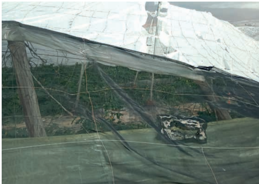
Las Norias, San Agustín, Santa María del Águila, Fuente Nueva o Pampanico son las zonas más afectadas.

Los daños en vías, alumbrado, parques y jardines, espacios públicos y en más de una treintena de edificios e instalaciones municipales asciende a 6.803.279 euros. Los principales daños son de rotura de claraboyas, cristales, lucernarios, techos, canaletas y