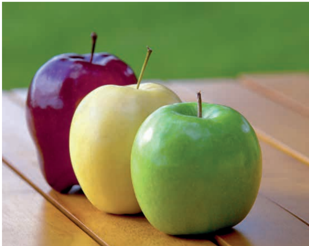
La exportación de manzanas, el principal producto del país, se mantiene estable, con una leve reducción en volumen (-2,83%) pero un incremento en valor del 8,20%, gracias a la consolidación de las variedades club.

Respecto al comercio internacional de los principales productos