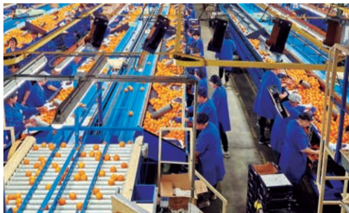
Los almacenes de confección valencianos trabajan ya a pleno rendimiento.

remarcaron que los principales daños causados al sector se dan en las infraestructuras agrarias, en los accesos a las parcelas y en las propias instalaciones y equipos de estas explotaciones (balsas, tuberías principales, pozos de riego, muros, vallados y cerramientos...). Con ser cierta y grave tal circunstancia no lo es menos que, en cuanto a las comarcas citrícolas, el grueso de las pérdidas causadas por la tromba de agua y el desborde de barrancos clave se ha producido en la Ribera Alta, la Ribera Baja y en municipios concretos de tradición citrícola como Pedralba (al noreste de la provincia, en Los Serranos). Para el resto de principales zonas productoras de esta provincia como fundamentalmente La Safor, donde se concentra buena parte de las bases del comercio citrícola privado español, Camp de Morvedre, Camp de Túria y con menor peso en cuanto a producción citrícola las de L'Horta Nord, Sur y Oeste así como, mucho más al sur, La Costera las lluvias han provocado problemas de menor consideración. En estas últimas zonas de la provincia de Valencia, como en el caso la práctica totalidad de la