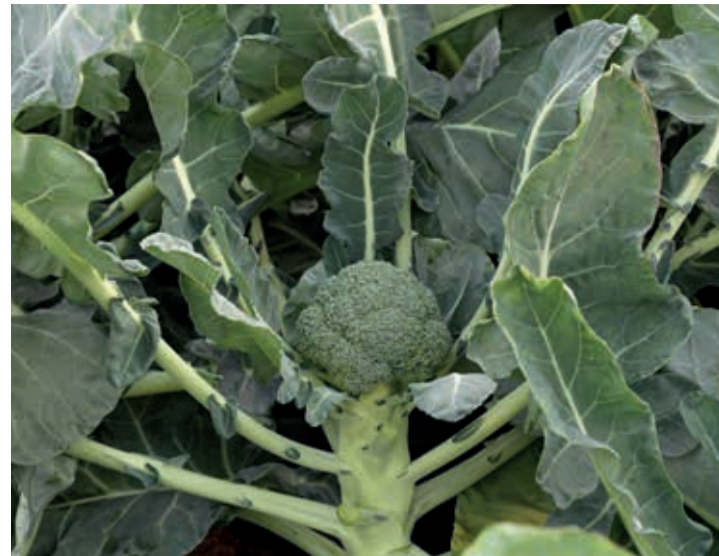
La Región de Murcia es la principal zona productora en España.

Reino Unido es el principal consumidor de este vegetal (cada persona consume hasta seis kilos al año) y es el principal comprador de las exportaciones de la Región de Murcia; primera productora de España. Según datos de MAPA, entre enero y febrero de 2024, esta comunidad autónoma incrementó un 27% las toneladas exportadas comparadas con los mismos meses de 2023. Siete de cada diez brócolis que se comercializan de España