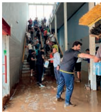
Voluntarios ayudando en las poblaciones afectadas.

El pueblo valenciano saldrá adelante con la ayuda de todos, mientras aprendemos de los errores, para que al final encontremos el camino para que nunca más se